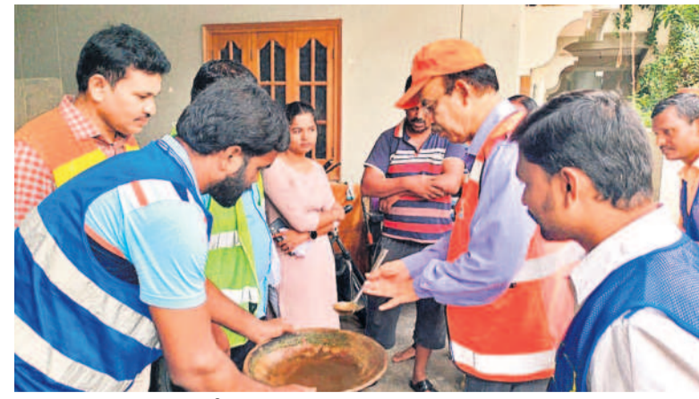
ప్రజలకు దేంగి వ్యాధి నివారణకు అవగాహన కల్పిస్తున్న బల్లియా సిబ్బంది

I హైదరాబాద్, గురువారం 18 జూలై 2024 HYDERABAD