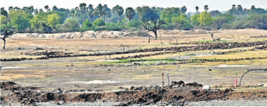
ఎండిన నల్లగొండ మండలంలోని ముషంపల్లి చెరువు

ఈ సీజన్ లో ఇప్పటి వరకు 146.8 మిల్లీమీటర్ల వర్షపాతం నమోదు కావాల్సి ఉండగా 195.2 మిల్లీమీటర్ల వర్షం పడి 93శాతం అదనపు వర్ష పాతం నమోదైనట్లు వాతావరణ శాఖ లెక్కలు చెబుతున్నాయి. 93శాతం అదనపు వర్షపాతం నమోదైతే 11.40 లక్షల ఎకరాలకు గానూ ఇప్పటి వరకు 3.75 లక్షల ఎకరాల మాత్రమే ఎందుకు సాగిందా? సమ్మర్ల వర్షాలు వాతావరణ శాఖ యంత్రాంగం లెక్కలు వేసి అధిక వర్షపాతం పడిందని ప్రభుత్వానికి నివేదించి తప్పుదోవ పట్టి స్పృహచేడి తోసి పుచ్చలేని అంశం.