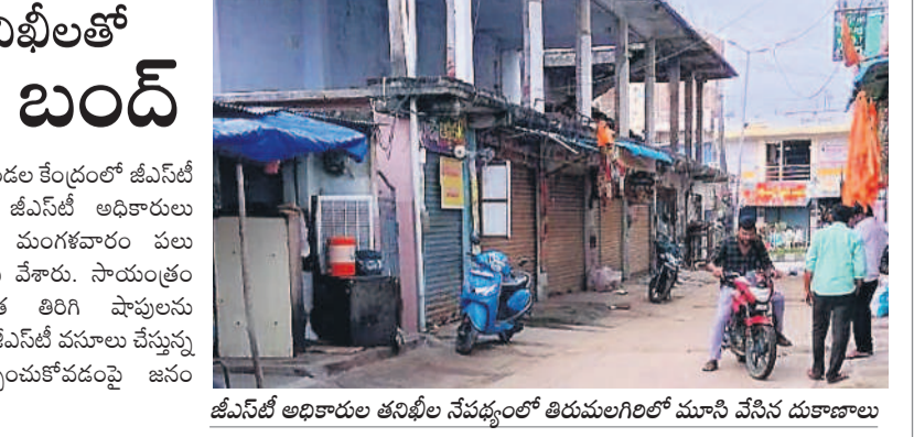
జీఎస్ టీ అధికారుల తనిఖీల నేపథ్యంలో తిరుమలగిరిలో మూసి వేసిన దుకాణాలు

తిరుమలగిరి, జూలై 16 : మండల కేంద్రంలో జీఎస్ టీ చెల్లింపులు పరిశీలించడానికి జీఎస్ టీ అధికారులు వస్తున్నారన్న సమాచారంతో మంగళవారం పలు వ్యాపార దుకాణాలను మూసి వేశారు. సాయంత్రం అధికారులు వెళ్లిన తర్వాత తిరిగి షాపులను నిర్వహించారు. ప్రజల నుంచి జీఎస్ టీ వసూలు చేస్తున్న వ్యాపారులు ఇప్పుడు తప్పించుకోవడంపై జనం సందేహం వ్యక్తం చేస్తున్నారు.