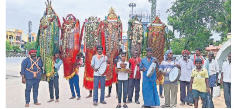
విట్యాలలో పీఠ ఊరేగింపు

రామగిరి, జూలై 16 : హిందూ, ముస్లింలకు పండుగ సంబరం కలిసి వచ్చింది. బుధవారం తొలి ఏకాదశి, మొహరం సందర్భంగా వేడుకలను నిర్వహించేందుకు సిద్ధమయ్యారు. తొలి ఏకాదశిని పురస్కరించుకొని భక్తులు ఆలయాల్లో ప్రత్యేక పూజలు చేయనున్నారు. ఉమ్మడి జిల్లా వ్యాప్తంగా ప్రముఖ దేవస్థానాలు విద్యుద్దీపాలతో ముస్తాబయ్యాయి. నడి జిల్లాలో పుణ్యస్థానాలు చేసి మొక్కులు తీర్చుకోనున్నారు. ఇక మొహరం నేపథ్యంలో ముస్లింలు భక్తి ప్రాధాన్యం చేయనున్నారు. ఇప్పటికే పీఠ సంధి గ్రామాలు, పట్టణాల్లో కోలాహలంగా సాగుతున్నది.