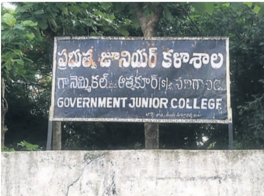
నెమ్మికల్ ప్రభుత్వ జూనియర్ కళాశాల

అత్యుక్త.ఎన్, జూలై 16 : మండల పరిధిలోని నెమ్మికల్ ప్రభుత్వ జూనియర్ కళాశాలలో విద్యార్థుల ట్యూషన్ ఫీజు, కళాశాల అభివృద్ధి కోసం ప్రభుత్వం అందజేసిన నిధులను విద్యార్థులు, కళాశాలకు ఖర్చు చేయకుండా గోల్ మార్ చేసినట్లు ఆరోపణలు వస్తున్నాయి. ఉన్నతాధికారులు విచారణ చేపట్టినా తప్పకుండా డిమాండ్ లోకిందిస్తాయి అధికారులు గుట్టు విప్పడం లేదన్న ఆరోపణలు వస్తున్నాయి. 2016-17లో నెమ్మికల్ కళాశాలకు మార్కెట్ వసతుల కోసం వివిధ రూపాల్లో రూ.4లక్షలు వచ్చినట్లు తెలిసింది.