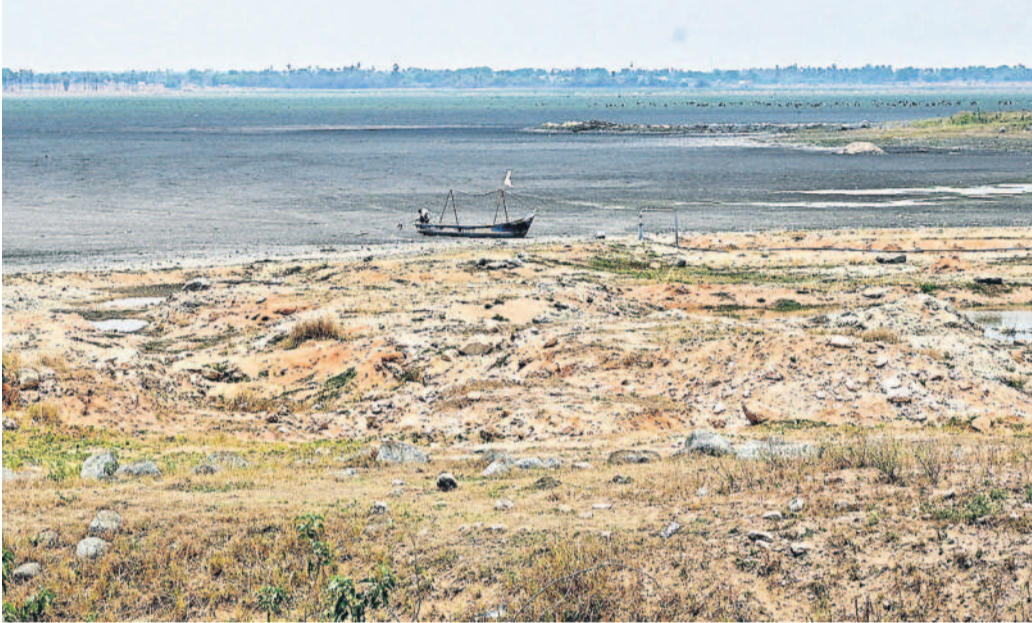
పూర్తిగా ఎండిన కనగల్ మండలంలోని మైల చెరువు

నల్లగొండ జిల్లాలో ఈ వానకాలం సీజన్ లో 11.40 లక్షల ఎకరాల్లో 3.75 లక్షల ఎకరాల్లోనే సాగు కావాల్సి ఉండగా ఇప్పటి వరకు 3.75 లక్షల ఎకరాల్లోనే సాగు అయ్యాయి. అందులో పత్తి 3.46 లక్షల ఎకరాలు, వరి 15వేల ఎకరాల్లోనే సాగు అయ్యింది. వర్షపాతం ఈ నెలలో 16.89 సెంటీమీటర్లు పడగా ఇంకా ఇప్పటి వరకు 3.46 సెంటీమీటర్లు మాత్రమే పడింది. జూన్ కంటే ఎక్కువ వర్షం పడినప్పటికీ అప్పటికి రైతులు ఎలాంటి సాగు ఆలోచన చేయకపోవడంతో పంటల సాగు గణనీయంగా తగ్గింది. కనీస వర్షపాతం నేపథ్యంలో గత యాసంగిని దృష్టిలో పెట్టుకొని ప్రభుత్వం కూడా పట్టించుకోవడనే ఆలోచనతో పంటల సాగులో రైతులు ముందుకు రాకపోవడం గమనార్హం.