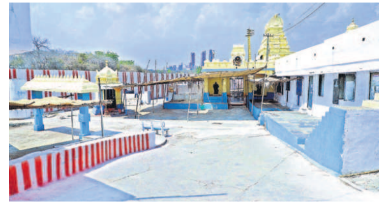
మరంపల్లిలో ఏకాదశి వేడుకలకు ముస్తాబైన లక్ష్మీనరసింహ స్వామి ఆలయం