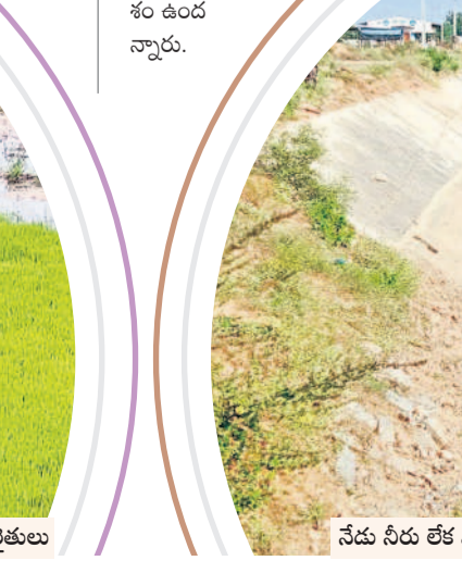
నేడు నీరు లేక వెలవెలబోతున్న కేఎస్సీ కుడి కాల్వ

నాడు జలకళ.. నేడు వెలవెల కేసీఆర్ ప్రభుత్వంలో నిండుగా పారిన కాల్వలు.. రేపటి సర్కారు రావడంతో నీళ్లు పారక వెలవెలబోతున్నాయి. గతేడాది జూలై మొదటి వారంలో కొయిలసాగర్ నుంచి కుడి, ఎడమ కాల్వలకు నీటి విడుదలతో పంట పొలాల్లో కృష్ణమృ పరవళ్లు తొక్కింది. ప్రస్తుతం జూలై మూడో వారం ప్రారంభమైనా ప్రాజెక్టులో నీటిమట్టం 18 అడుగులకు చేరింది. ఇంకా ఆయకట్టుకు సాగునీరు విడుదల కాలేదు. దీంతో కెనాల్స్, లిఫ్ట్ ఒట్టిబోయాయి. -మంజులక్ష్మి, జూలై 16