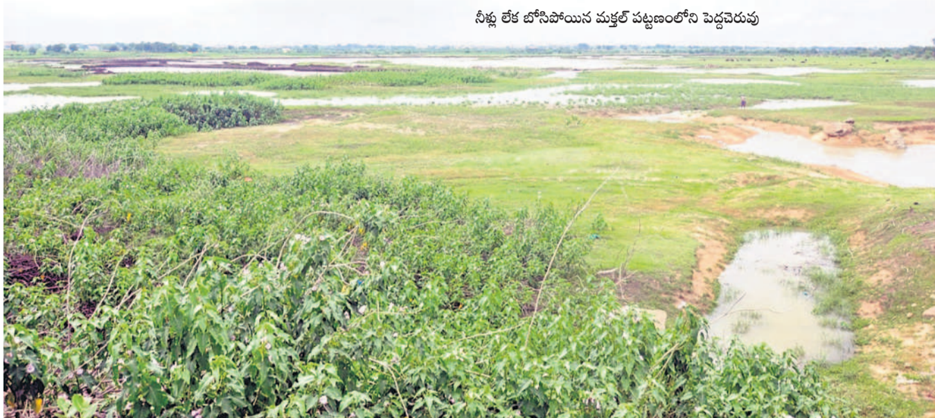
నీళ్లు లేక బోసిపోయిన మక్కల్ పట్టణంలోని పెద్దచెరువు

ముస్లింల అలయాలు. తొలి ఏకాదశికి వైష్ణవ అలయాల్ని సుందరంగా ముస్లింలయ్యాలు. ఏకాదశిని పురస్కరించుకొని బుధవారం వైష్ణవాలయాలలో పూజలు చేయనున్నారు. తెలంగాణజామి నుంచే అభిషేకాలు, అర్చనలు ఆయా అలయాల్లో అర్చకులు చేసేందుకు ఏర్పాట్లు పూర్తి చేశారు. అరుగుంటలకు నిర్మాణ వివర్ధన, ఫలంహస్తామి అభిషేకాలు, తులసి, పుష్పార్చనలు వంటి కార్యక్రమాలు నిర్వహిస్తారు.