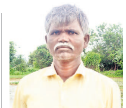
పంట చేతికందుతుందో లేదో..

ఈ ఏడాది అంతంత మాత్రమే వానలు కురుస్తున్నాయి. బోరు బావిలో నీరు సరిగ్గా లేకపోవడంతో పదికొరాలకు బదులు రెండు ఎకరాల్లో వరి సాగు చేసేందుకు కలిగి వేసుకుంటున్నారని మూడు పెద్ద వర్షాలు పడితే తప్పా చెరువులు, కుంటలు నిండి పరిస్థితి లేదు. పంట పండి చేతికి వచ్చేదాక భరోసా లేదు. పెట్టుబడులకు అప్పులు చేసినా దేవుని మీద భారం వేసి వరి సాగు చేస్తున్నా..