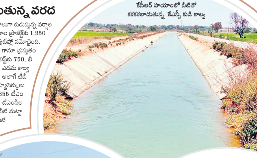
కేసీఆర్ హయాంలో నీటితో కళకళలుతున్న కేఎస్సీ కుడి కాల్వ