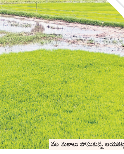
వరి తుకాలు పోసుకున్న ఆయకట్టు రైతులు

రిజర్వాయర్లకు కృష్ణమృ పరుగులు • రైతుల సంతోషం వీపనగండ్ల, జూలై 16 : జూరాల ప్రాజెక్టు పరిధిలోని రామచంద్రావతి రిజర్వాయర్ నుంచి రెండు రోజులుగా నీటిని విడుదల చేస్తున్నారు. మండలంలోని గోపల్ దినె రిజర్వాయర్లకు జూరాల నీరు చేరడంతో అన్నదాతలు, మత్స్యకారులు సంతోషం వ్యక్తం చేస్తున్నారు. 0.36 టీఎంసీ కేపాసిటీ గల గోపల్ దినె రిజర్వాయర్ నుంచి ఉమ్మడి వీపనగండ్ల మండలానికి సಂಬంధించిన గోపల్ నగరి, వీపనగండ్ల, వెలగొండ, అమర్వాసుల్లి, చిన్నదగడ, పెద్దదగడ, గూడెం, బెక్కెం, మియాళ్ళపూర్, గడ్డబాస్సు పురం, లక్ష్మీపల్లి, కొప్పునూర్, పెద్దనూరూర్, గోష్వాపూర్, కొండూరు తదితర గ్రామాల్లో దాదాపు 30 వేల ఎకరాల్లో పంటలు పండించుకునే అవకాశం ఉన్నది. కొంతమంది రైతులు ఇదివరకే వరి తుకాలు పోసి వరి పంట సాగు చేసేందుకు ఏర్పాట్లు చేసుకొన్నారు.. మరీకొంత మంది గోపల్ దినె రిజర్వాయర్ నుంచి నీరు చేరుతుండడంతో పంటల సాగుకు సన్నద్ధమవుతున్నారు. అయితే త్వరగా గోపల్ దినె రిజర్వాయర్ నుంచి సాగునీటిని విడుదల చేయాలని రైతులు కోరుతున్నారు.