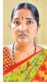
- బాలమ్మ, పానగల్, వనపర్తి జిల్లా

సరాలు గుంజు తున్నాయని పాస్ గల్ సంచి పెద్ద దవాఖానకు వచ్చినా.. పై దుర్మలు పరిశీలించి మందులు మాత్రం బయటనే తీసుకోమన్నారు. దవాఖానలో అన్ని ఉంటాయని సర్కారు చెబుతుంది. వీలేమీ బయట తెచ్చుకోమంటారు. మాకు అర్థం కావడం లేదు. అంతదూరం నుంచి వస్తే.. కనీసం ఒక్క గోలి కూడా ఇవ్వకుండా అన్నీ బయటే తెచ్చుకోమంటున్నారు.