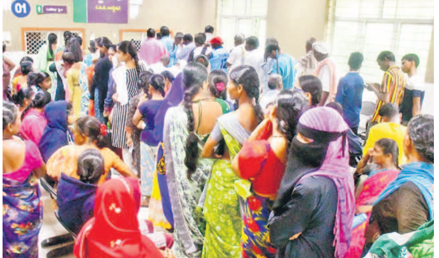
వనపర్తి జిల్లా దవాఖానలో ఓపీ లిజిస్ట్రేషన్ కోసం బారులుదీరిన ప్రజలు