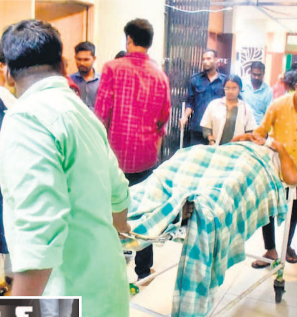
వనపర్తి జిల్లా దవాఖానలో చికిత్స కోసం వచ్చిన రోగిని స్వయంగా స్ట్రెచ్ చేసి తీసుకెళ్తున్న కుటుంబసభ్యులు

కలకత్తి రూరల్, జూలై 15 : కలకత్తి పట్టణంలోని సర్కారు దవాఖానలో బదారు నెలలుగా మందులు అరకొరగానే సరఫరా చేస్తున్నారు. మూడు జాతీయ రహదారులకు అతి సమీపంగా ఉన్న ఈ దవాఖానలో వైద్య సిబ్బంది ఉన్నప్పటికీ మందుల సరఫరా మాత్రం సక్రమంగా లేదు. ప్రతి రోజు దాదాపుగా నాలుగు వందలకు పైగా రోగులు దవాఖానకు వస్తున్నప్పటికీ వారికి యాంటీ బయోటిక్స్ మందులు లేకపోవడంతో ఇటు రోగులు, అటు వైద్య సిబ్బంది సైతం ఇబ్బంది పడుతున్నారు. దవాఖానకు సాధారణ రోగులు, పాయిజన్ కోసులు, వాంతులు వీరవనాలు, జ్వరాలు, వంటి రోగాలకు వైద్యం కోసం వస్తుండడంతో ఎక్కువగా యాంటీ బయోటిక్స్ అందిస్తూ సేవలందిస్తారు. రోగులకు అందించే వైద్య సేవల నిమిత్తం పరిస్థితుల మేరకు దవాఖాన ఎవరైతే బడ్జెట్ ద్వారా అవసరమైన మందులను కొని తెచ్చుకుంటున్నారు. అత్యవసర పరిస్థితుల్లో బయటనుంచి తెప్పించుకోవాల్సి వస్తోందిని రోగుల బంధువులు పేర్కొంటున్నారు. సీజనల్ వ్యాధులకు సంబంధించి కొన్ని రకాల మందులు ఉన్నప్పటికీ యాంటీ బయోటిక్స్ పూర్తిగా, ఇంజక్షన్లు మాత్రం సీడిఎస్ (సెంట్రల్ డ్రగ్స్ సప్లై) మహబూబ్ నగర్ నుంచి సరఫరా కావడం లేదు. వీటితోపాటు ఓఆర్ఎస్, ఆర్ఎల్ ఎల్ పూర్తిగా, చిన్నపిల్లలకు అందించే సిరబులు కూడా సక్రమంగా సరఫరా కావడం లేదు. గత ప్రభుత్వం సర్కారు ద దవాఖానల అభివృద్ధికి మందుల సరఫరా ఎప్పటికప్పుడు అందించాలి మెరుగైన వైద్యాన్ని అందిస్తే.. ప్రస్తుత ప్రభుత్వం మందులను కూడా సక్రమంగా అందించలేని దుస్థితిలో ఉన్నది. ప్రతిసారీ అవసరమైన మందులను పంపించేందుకు సీడిఎస్ కు ప్రతిపాదనలు పంపినా ప్రభుత్వం నుంచి సరఫరా లేకపోవడంతో అందించలేకపోతున్నామని సిబ్బంది చెబుతున్నారు.