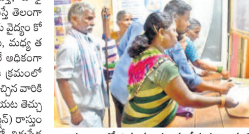
అందుబాటులో ఉన్న మందులను తీసుకుంటున్న రోగులు

జిల్లా దవాఖానకు అన్ని వ్యాధులకు సంబంధించి దాదాపు 500 నుంచి 800 మంది వరకు పేషెంట్లు వస్తున్నారు. 450 పడకలతో సదుపాయాలు ఈ దవాఖానకు రోగుల తాకిడి తీవ్రంగానే ఉన్నది. చిన్నారులు, పెద్దలతోపాటు ఆరోపిడిట్, డెంటిస్ట్, ఈఎన్టీ తదితర విభాగాల వారికీ జిల్లాలోని నలుమూలల నుంచి పేషెంట్లు వస్తున్నారు. ప్రస్తుతం వరకాలం సీజన్ ఉండడంతో మరింత మంది పెరుగుతున్నారు. ప్రజలు సాధారణ జ్వరాలతోపాటు మలేరియా, డెంగి తదితర రోగాల బారిన పడుతున్నారు. వర్షాలు మరింత పెరిగితే.. రోగాలు ఎక్కువగా వస్తే అవకాశం ఉన్నది. పెండింగ్లో నిధులు.. జిల్లా దవాఖానకు దాదాపు నాలుగు కార్పొరేషన్ల సంబంధించిన బడ్జెట్ రాబోయింది. మందుల సరఫరా