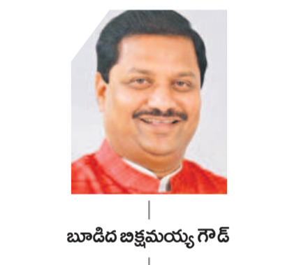
బూడిద బజ్జీమయ్య గౌడ్