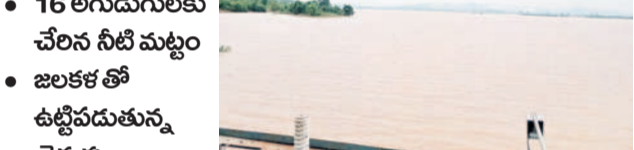
జలకళను సంతరించుకున్న బయ్యారం పెద్దచెరువు