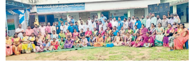
అక్షయ సమ్మోక్షంలో కలుసుకున్న పూర్వవిద్యార్థులు