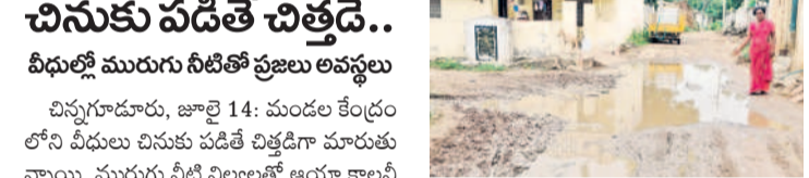
విన్నగూడూరులో రోడ్డు నిలిచిన మురుగు నీటిని చూపుతున్న మహిళ