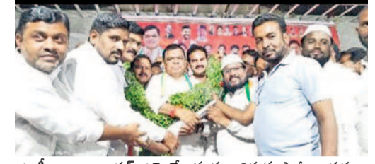
ఎంపీ బలరాంనాయక్, ఎమ్మెల్యేలను సన్మానిస్తున్న పార్టీ నాయకులు

ఎంపీ పాఠిక బలరాంనాయక్ మహాబూబాబాద్ రూరల్, జూలై 14: రాష్ట్రంలోని నిరుపేదలందరికీ ప్రభుత్వ సంక్షేమ పథకాలు అందజేస్తామని ఎంపీ పాఠిక బలరాంనాయక్ అన్నారు. ఆదివారం పట్టణంలోని బాలాజీ గార్డెన్లో కాంగ్రెస్ పార్టీ జిల్లా అధ్యక్షుడు భరత్ చంద్రా రెడ్డి అధ్యక్షులతో ఎంపీ బలరాంనాయక్ను సన్మానించారు. ఈ సందర్భంగా ఎంపీ మాట్లాడుతూ.. ఎన్నికల సమయంలో ఇచ్చిన అన్ని హామీలను అమలుచేసి విధిగా ప్రభుత్వం ప్రణాళికా ప్రకారం పాలన అందిస్తుందన్నారు. ఇప్పటికే మహిళలకు ఉచిత బస్సు సౌకర్యం, 200 యూనిట్ల ఉచిత విద్యుత్ అందిస్తున్నామని, రైతులకు రైతు భరోసా అందించేంక అభిప్రాయ సేకరణ చేపట్టినట్లు తెలిపారు. కార్యక్రమం అధ్యక్షుడొద్ద, పార్టీకోసం పనిచేసిన ప్రతి ఒక్కరికీ న్యాయం జరుగుతుందన్నారు. అనంతరం పార్టీ జిల్లా నాయకులు ఎంపీ బలరాంనాయక్, ప్రభుత్వ విప్ రామ చంద్రానాయక్, ఎమ్మెల్యే మురళీనాయక్ను గజమలతో సత్కరించారు. కార్యక్రమంలో కాంగ్రెస్ నాయకులు పాల్గొన్నారు.