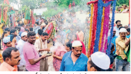
వీరలను ఊరేగిస్తున్న ముస్లింలు