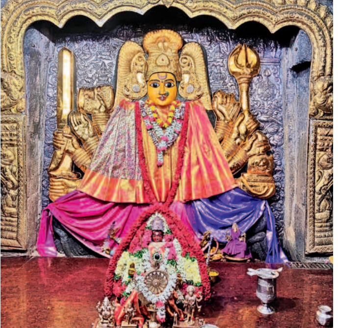
శాకంబరి సవరణకు తోడ్పడి రోజు ఉగ్రప్రభా మాతగా అమ్మవారు