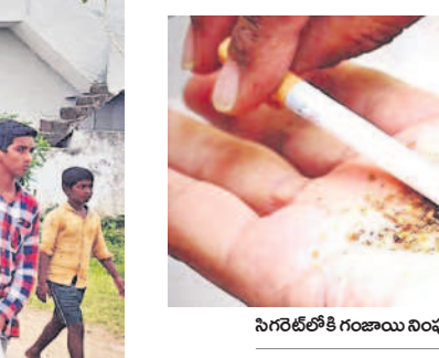
సిరిసిల్లలో గంజాయి వింపుతున్న డ్యూటో

దింపుతున్నారు. కఠినంగా వ్యవహరించాల్సిన కళాశాలల యాజమాన్యాలను, పోలీసుశాఖలు మాత్రం చూసేచూడడం ట్టుగా వ్యవహరిస్తున్నాయని విద్యార్థులు ఆరోపిస్తున్నారు. ఇటీవల ఇబ్రహీంపట్నం సమీపంలోని గురునానక్ ఇంజనీరింగ్ కళాశాలలో విద్యనభ్యసించే ఇబ్రహీంపట్నంలోని ఓ పైవేటు వసతిగృహంలో ఉండే ఓ విద్యార్థిని అడిగినప్పుడు నాతో పక్క రూంలో ఉండే విద్యార్థులు గంజాయికి బానిసలు లుగా మారి రాత్రి సమయాల్లో ఇబ్బందులకు గురిచేస్తున్నారని తెలిపారు. గంజాయికి బానిసలుగా మారిన