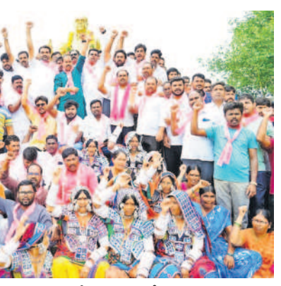
అంతర్జాతీయ విగ్రహం ఎదుట ఆందోళన చేస్తున్న టీఆర్ఎస్ శ్రేణులు

గంజాయి దందాపై ఉక్కుపాదం మోపుతాం. ఇటీవల గంజాయితో పట్టుబడిన వారిని రిమాండ్ చేశారు. ప్రధాన రహదారులు, టెటర్నింగ్ రోడ్లలో పాటు అనుమానిత ప్రాంతాల్లో తనిఖీలు చేపడుతున్నాం. గంజాయి సేవీస్తే వచ్చే ఆనందం అవగాహన కల్పిస్తున్నాం. గంజాయి సేవీస్తున్నట్లుగాని, విక్రయిస్తున్నట్లుగాని తెలిస్తే గ్రామస్థులు వెంటనే పోలీసులకు సమాచారం ఇవ్వాలి.