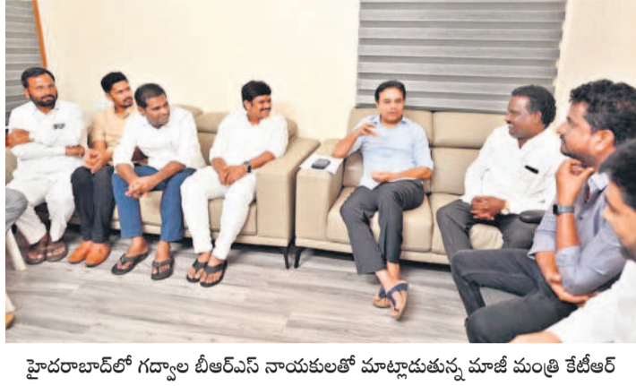
హైదరాబాద్ లో గద్వాల బీఆర్ఎస్ నాయకులతో మాట్లాడుతున్న మాజీ మంత్రి కేటీఆర్

తెలంగాణ రాష్ట్ర అభివృద్ధి కమిషన్ కేసులో పలు సాకారమైన ఈ లిఫ్ట్ గత ఏడేనిమిదేండ్లు పట్టిన పంటల సేవలను అందించింది. అలాంటి ఈ ప్రాజెక్టు ఇప్పుడు బోసిపోయింది. వర్షాలు కురవకపోవడం.. కర్షకులకు నుంచి కట్టలకు వరద వానకాలం తో పోషకంగా ఉన్నప్పుడు వరద వానకాలంలో నిండుగా నీటితో ప్రవహించే కంటలోని జోన్లు బోసి, గుడిపల్లి, ఎల్లూరు జలాశయాల్లో నీటి మట్టాలు అధికమవుతున్నాయి. గతంలో నిండుగా నీటితో కట్టలు నిండుగా ఉండగా, కాలాల్లో నిరంతరం నీళ్లు ప్రవహించాయి. ఇలా ఏండ్ల తరువాత కట్టలు నిండుగా ఉండగా, కాలాల్లో నిండుగా నీటితో ప్రవహించాయి. కానీ ఈ సందర్భంలో నీళ్లు లేక బోసిపోయింది. గ్రామాలకు నీళ్లు తీసుకోలేక కాలాల్లో పంటలు పండించే అసాధ్యం. గట్టి దర్భణమిస్తున్నాయి. సంబంధిత ఇంజనీర్ల శాఖ అధికారులు సైతం కాలాల్లో ఉన్నప్పుడు ముందస్తుగా సిద్ధం చేయాలి ఉన్నప్పుడు కున్న దాబాబో లెవ్వు కాంగ్రెస్