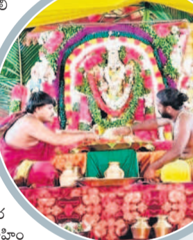
వేంకటేశుడి కల్యాణం నిర్వహిస్తున్న అధ్యక్షులు

నాగర్ కర్నూల్ లో గోవింద నామస్మరణతో మార్పెట్టి నామస్మరణం 75 మంది పరమ హితులకు మోక్షాన్ని తెచ్చుతుంది. అధికారులు ప్రార్థనలు చేపట్టారు. 75 మంది పరమ హితులకు మోక్షాన్ని తెచ్చుతుంది. అధికారులు ప్రార్థనలు చేపట్టారు. 75 మంది పరమ హితులకు మోక్షాన్ని తెచ్చుతుంది. అధికారులు ప్రార్థనలు చేపట్టారు.