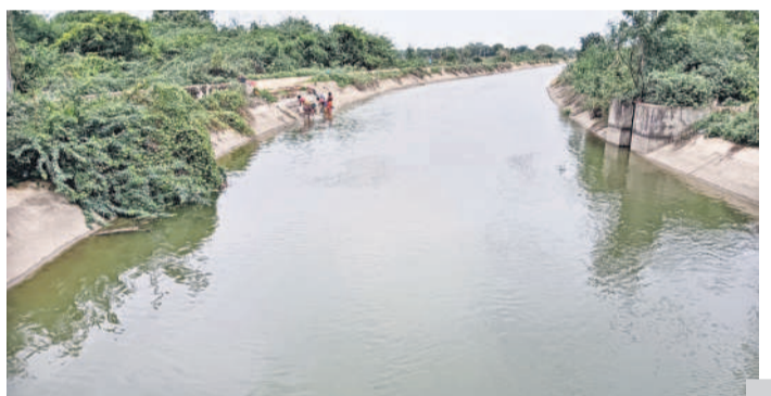
పెద్దేరు వద్ద నిండుగా పారుతున్న జారాల ప్రధాన ఎడమ కాలువ