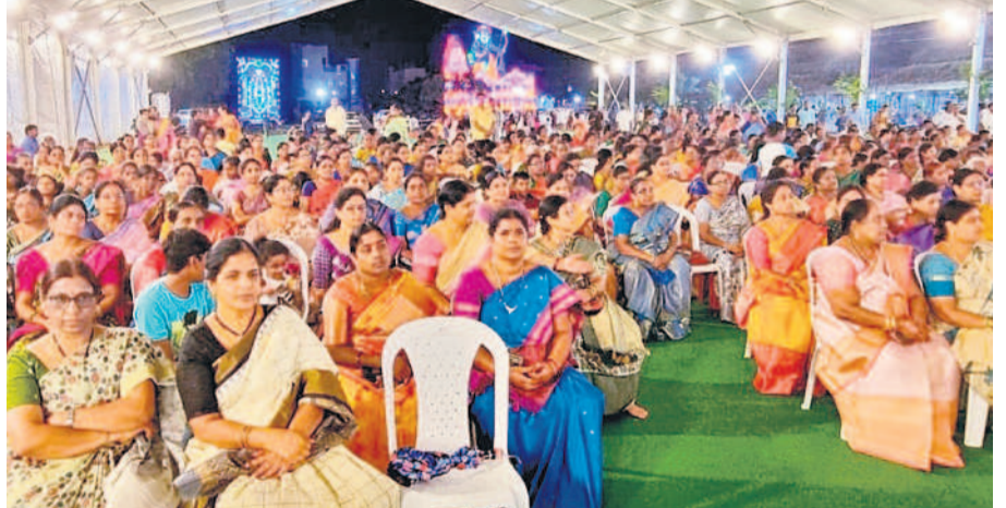
వేంకటేశుడి కల్యాణం మహోత్సవానికి హాజరైన భక్తులు