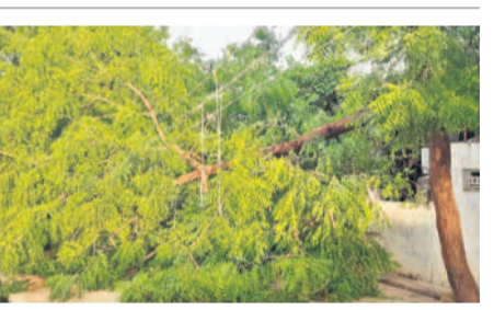
విద్యుత్ తీగలు, కారుపై పడిన వేప చెట్టు

పెద్దేరు, జూలై 13 : ఎట్టకేలకు జురాల అయకట్టుకు అధికారులు సాగునీటిని శనివారం విడుదల చేశారు. పెద్దేరు మండల పరిధిలోని ప్రధాన ఎడమ కాలువలో నీళ్లు నిండుగా ప్రవహిస్తున్నాయి. సాగు ప్రాజెక్టులకు వరద వానకాలం వినీ వరకు రైతుల విజృంభణ అధికారులు సాగునీటిని విడుదల చేశారు. కాగా, నీటిని డిస్ట్రిబ్యూట్ చేయడంలో అధికారులు ప్రయత్నం చేస్తున్నారు.