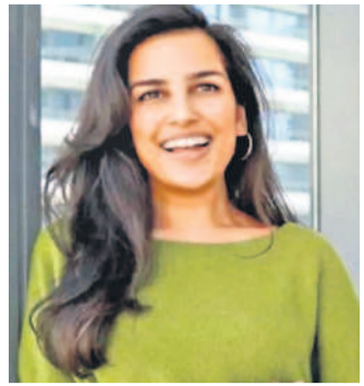
వదిలేసిన తర్వాత తొమ్మిది నెలలపాటు జీవించడానికి తగిన సొమ్మును భద్రపరిచినాని తెలిపారు. తన యూట్యూబ్ చానల్ లకు ప్రజారాజ అంత్ టీలికా లభించలేదని... 1,000 మంది సబ్ స్క్రిబర్లు రావడానికి 11 నెలలు పట్టిందని తెలిపారు. 2022 సెప్టెంబరులో తన జీవితం గురించి చేసిన మీడియా వైరల్ అవడంతో సబ్ స్క్రిబర్ల సంఖ్య 50

బ్యాంకింగ్ రంగంలో తాను కేవలం కార్టోల్ వస్తూ, ప్రభుత్వాలకు మాత్రమే సహాయం చేస్తున్నానని, ఇంకా ఎక్కువ మందికి తన వల్ల ప్రయోజనం కలగాలని ఆకాంక్షించారు. ఈ నేపథ్యంలో 2023 జనవరిలో ఉద్యోగాన్ని వదిలేసి, చర్యనల్ పై నాన్ స్టాఫ్ లో ఫుల్ టైమ్ కంటింటి క్రియేటర్ గా మారారు. అప్పటి నుంచి ఈ ఏడాది మే నెల వరకు రూ. 8 కోట్లు సంపాదించారు. యూట్యూబ్ మానెజ్మెంట్ వనరులను, కోర్టులు, ప్రొడ్యూస్ అమ్మకం, కార్టోల్ లో చర్యలు నిర్వహించడం, ప్రముఖ బ్రాండ్లతో భాగస్వామి కావడం ద్వారా ఈ సొమ్మును సంపాదించారు. ఈ మనక గురించి నిజా షా మాట్లాడుతూ, తాను బ్యాంకింగ్ లో ఉన్నప్పుడు కనీసం ఇప్పుడు అప్పుడుగా సంపాదిస్తున్నానని చెప్పారు. ఇప్పుడు డబ్బు వెంట పరుగులు తీయకుండా, కేవలం తనకు నచ్చినవారిని, తనకు ఇష్టమైనవారిని చేయడం ద్వారా సంపాదిస్తున్నానని చెప్పారు. ఉద్యోగాన్ని