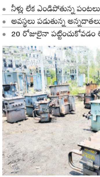
వెంకంపల్లి వద్ద కాలిపోయిన ట్రాన్స్ ఫారర్

నల్ సేషన్ లిపేర్ కోసం తీసుకువచ్చిన ట్రాన్స్ ఫారర్లు గంగాధర, జూలై 12 : గంగాధర మండలంలోని నాగిరెడ్డి పూర్, న్యాలకొండపల్లి, వెంకంపల్లి గ్రామాల్లో 20 రోజుల క్రితం నాలుగు 16కేపీ విద్యుత్ ట్రాన్స్ ఫారర్లు కాలిపోయాయి. దీంతో రైతులకు ఇబ్బందులు ఎదురవుతున్నాయి. వెంకంపల్లిలో ఇప్పటికే పరి నాల్గు ముదిరిపోగా, పోసిన నారుమడులు కూడా ఎండిపోతున్నాయి. సమస్య ఇలాగే ఉంటే తీవ్ర నష్టం వచ్చే ప్రమాదమున్నది. నాగిరెడ్డిపూర్ పరిధిలో ట్రాన్స్ ఫారర్లను రిపేర్ చేయకపోవడంతో నాల్గు కూడా పోయలేని దుస్థితి ఉన్నది. న్యాలకొండపల్లి పల్లి పరిధిలో పంటలకు నీరందక ఇబ్బంది పడుతున్నారు. అయితే ట్రాన్స్ ఫారర్ల మరమ్మత్తులో కాంట్రాక్టర్ల నాణ్యతా ప్రమాణాలు పాటించకపోవడంతోనే అవి తరచూ కాలిపోతున్నాయని రైతులు మండిపడుతున్నారు. నెల రోజుల క్రితం బారు గువల్లిలో కాలిపోయిన ట్రాన్స్ ఫారర్ల రిపేర్ చేసి బిగ్గి ఇప్పటికే మూడు నాల్గు, వెంకంపల్లిలో 20 రోజుల్లోనే ట్రాన్స్ ఫారర్ల ఐదు నాల్గు కాలిపోయిందని చెబుతున్నారు. తరచూ ట్రాన్స్ ఫారర్లు కాలిపోతుండడంతో రవాణా, ఇతర ఖర్చులు తడిసి మోపెడవుతున్నాయని ఆవేదన చెందుతున్నారు. అధికారుల పర్యవేక్షణలో, కాంట్రాక్టర్ల నాసిరకం పనులతో కాము ఇబ్బందులు పడుతున్నాయని వాపోతున్నారు.