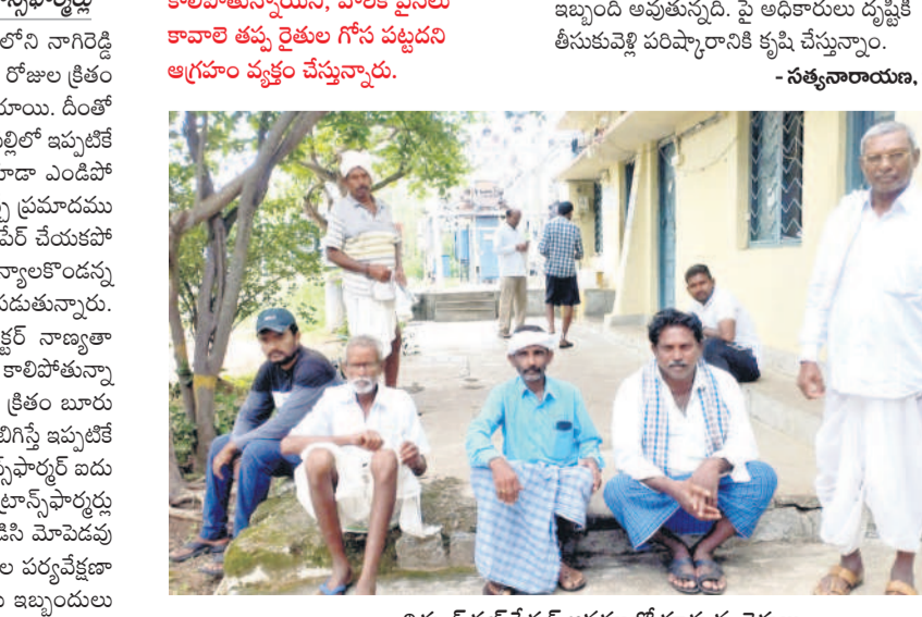
విద్యుత్ సబ్ స్టేషన్ ఆవరణలో కూర్చున్న రైతులు

అసలే పర్యాటకం.. అపై కంటి కోతలు.. ఈ రెండు సమస్యలను అధిగమించుకుంటూ పంటలను ఎలాగోలా దక్కించుకుంటూ సహజతమపుత్రుల రైతులకు ఇప్పుడు తరచూ ట్రాన్స్ ఫారర్లు కాలిపోతుండడం పుండుతుంది కారంపల్లినట్లుగా మారింది. పరినాల్గు కాపాడుకోవడానికి ఇప్పటికే నానా తంటాలు పడుతుండగా, విద్యుత్ శాఖ అధికారులు తీరు వారిని మరిన్ని కష్టాల్లోకి నెడుతున్నది. గంగాధర మండలంలోని వివిధ గ్రామాల్లో ట్రాన్స్ ఫారర్లు కాలిపోయి 20 రోజులు గడుస్తున్నా, అధికారులు పట్టించుకోవడంతోనే వేసిన పంటలు ఎండిపోతున్నాయని రైతులు ఆందోళన చెందుతున్నారు. పడేళ్లలో ఎట్ల నడిచినయని, ఇప్పుడెట్ల కాలిపోతున్నాయని ప్రశ్నిస్తున్నారు. కాంట్రాక్టర్ల నాసిరకం మరమ్మత్తులు చేయడంతో ట్రాన్స్ ఫారర్లు వెంట వెంటనే కాలిపోతున్నాయని, వారికి పైనను కావాలి తప్ప రైతుల కోసం పట్టదని ఆగ్రహం వ్యక్తం చేస్తున్నారు.