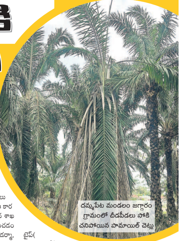
దమ్మపేట మండలం జగ్గారం గ్రామంలో వీడవీడలు సాకి చనిపోయిన పామాయిల్ చెట్టు

పామాయిల్ సాగు అంటేనే 'పేట' అనేలా.. యిల్ గిలల ధర 2024 నాటికి రూ.18,705కు పడిపోవడం రైతులను దెబ్బతీస్తోంది. పైగా పెరుగుతున్న సాగు ఖర్చులను.. ప్రస్తుత దిగుబడులను బేరిజు వేసినప్పుడు తాము మరింత సస్టైనబుల్ కూరుకుపోతున్నారని రైతులు ఆవేదన వ్యక్తం చేస్తుండడం గమనార్హం.