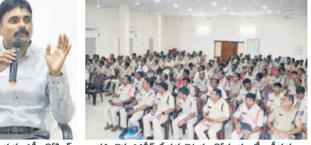
మాట్లాడుతున్న ఎస్పీ రోహిత్ రాజు. హాజరైన పోలీస్ స్టేషన్ల చైర్మన్లు, కొద్దూ డ్యూటీ ఆఫీసర్లు

కొత్తగూడెం జైం, జూలై 12 : న్యాయాధికారులతో సమన్వయం పాటిస్తూ పాత కేసుల పరిష్కారానికి కృషి చేయాలని భద్రాద్రి ఎస్పీ రోహిత్ రాజు పోలీసు అధికారులకు సూచించారు. కొత్తగూడెంలోని ఐఎంఐ ఫంక్షన్ హాల్లో జిల్లాలోని అన్ని పోలీస్ స్టేషన్లలో పనిచేస్తున్న కొద్దూ డ్యూటీ కానిస్టేబుళ్లు, రైలువూ, టిక్ టీఎం ఆఫీసుల్లో శుక్రవారం సమావేశం నిర్వహించారు. ఈ సందర్భంగా ఎస్పీ మాట్లాడుతూ పెండింగ్ లో ఉన్న కేసుల సక్రమ పరిష్కారానికి బాధ్యతగా విధులు నిర్వహించాలని సూచించారు. వీటిలో ఏవైనా సందేహాలంటే డీసీఆర్ కి అధికారులకు తెలియజేసి వాటిని నిష్పత్తి చేసుకోవాలన్నారు. కేసు సమన్వయంలో సుందరి పరిష్కారం అయ్యే వరకు ప్రతీ విషయాన్ని ఆన్ లైన్ లో