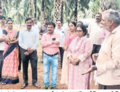
సేంద్రియ వ్యవసాయంపై అప్రూజు చేయాలని ఆయన కోరారు

ములకలపల్లి, జూలై 12 : రైతులు సేంద్రియ వ్యవసాయంపై దృష్టి సారించి లాభాలు గడించాలని, ప్రభుత్వ సబ్సిడీని సద్వినియోగం చేసుకుంటూ సాగును మరింతగా విస్తరించాలని భద్రాద్రి కలెక్టర్ జితేష్ వి పాటిల్ సూచించారు. ములకలపల్లి మండలంలో శుక్రవారం పర్యటించిన ఆయన తొలుత జూనియర్ కళాశాలను సందర్శించారు. కళాశాల భవనాలు శిథిలావస్థకు చేరడంతో వాటి మరమ్మతులు, కొత్త భవనాల నిర్మాణం కోసం ప్రతిపాదనలు సిద్ధం చేయాలని అధికారులను ఆదేశించారు. అనంతరం కన్వెన్షన్ గాంధీ బాంకల పాఠశాలను పరిశీలించారు. తర్వాత సేంద్రియ విధానంలో సాగు చేస్తున్న రైతులను పంపిణీ చేయాలని ఆయన పరిశీలించారు. ఈ సందర్భంగా రైతుతో మాట్లాడి సాగు వివరాల గురించి తెలుసుకున్నారు. తేనెతీగలు, నాలుకొక్క పెంపకం, సేంద్రియ వ్యవసాయం చేస్తే వచ్చే లాభాలపై రైతులకు వివరించారు. అనంతరం రైతులను సేంద్రియ వ్యవసాయంపై దృష్టి పెట్టాలని ఆయన కోరారు. కార్మికులను సేంద్రియ వ్యవసాయంపై అప్రూజు చేయాలని ఆయన కోరారు.