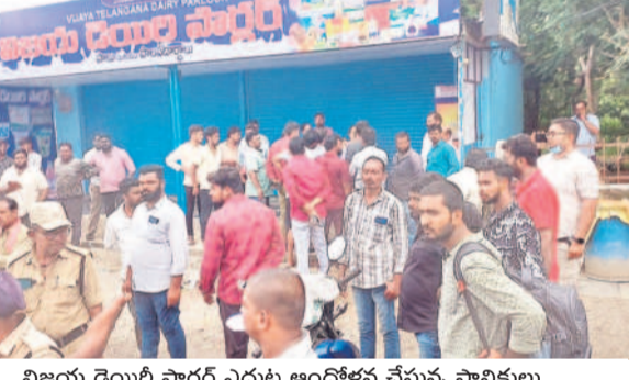
విజయ డెయిలీ పార్లర్ ఎదుట ఆందోళన చేస్తున్న స్థానికులు

రఘునాథపాలెం, జూలై 12 : విజయ డెయిలీ పార్లర్ నిర్వహణను స్థానికులకే కేటాయించాలంటూ రోలీసీగర్ వాసులు ఆందోళన చేపట్టారు. స్థానికులకు కాకుండా ఓ ఏజెన్సీకి అనుమతులు తెచ్చుకోవడంతో విషయం తెలిసి స్థానికులు పెద్దఎత్తున పార్లర్ వద్దకు చేరుకొని నిరసన తెలిపారు. వివరాలలో కొద్ది.. ఖమ్మం విజయ డెయిలీ ఎదుట పాలు, పాల ఉత్పత్తులను విక్రయించేందుకు కేటాయించిన పార్లర్ నిరసన గతంలో స్థానిక ఏజెన్సీకి కేటాయించారు. అయితే గడువు ముగియడంతో గత కొద్దిరోజులూ పార్లర్ నిర్వహణ ఆగిపోయింది. ఎన్నికల అనంతరం తిరిగి స్థానిక ఏజెన్సీ నిర్వహణకు తిరిగి అనుమతులు తెచ్చుకోవడంతోపాటు శుక్రవారం ప్రారంభించేందుకు ఏర్పాటు చేస్తున్నారు. విషయం తెలిసిన రోలీసీగర్ వాసులు పార్లర్ వద్దకు చేరుకొని ప్రాంతోత్పత్తి వాన్ని అడ్డుకున్నారు. పార్లర్ ఎదుట బెయిలుంది పున:ప్రారంభం