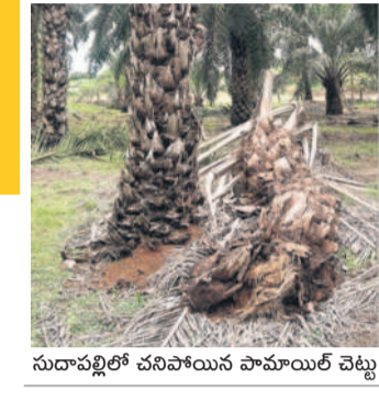
సుపాల్లిలో చనిపోయిన పామాయిల్ చెట్టు

పామాయిల్ సాగు అంటేనే 'పేట' అనేలా.. యిల్ గిలల ధర 2024 నాటికి రూ.18,705కు పడిపోవడం రైతులను దెబ్బతీస్తోంది. పైగా పెరుగుతున్న సాగు ఖర్చులను.. ప్రస్తుత దిగుబడులను బేరిజు వేసినప్పుడు తాము మరింత సస్టైనబుల్ కూరుకుపోతున్నారని రైతులు ఆవేదన వ్యక్తం చేస్తుండడం గమనార్హం.