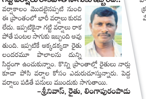
గట్టి వర్షాలు రాకపోతే సాగుకు ఇబ్బం.. వర్షాలకుం మొదలైస్తున్న నీరు ఈ ప్రాంతంలో భారీ వర్షాలు కురవలేదు. ఇప్పటికైనా గట్టి వర్షాలు రాకపోతే పంటల సాగుకు ఇబ్బంది అవుతుంది. ఇప్పటికే అక్కడక్కడా రైతులందరూ పొలాలను దున్ను నిద్దంగా ఉంచుతున్నారు. కొన్ని ప్రాంతాల్లో రైతులు నార్డు కూడా పోసి వర్షాల కోసం ఎదురుచూస్తున్నారు. పెద్ద వర్షాలు పడితే పనులు ముందుకు సాగుతాయి.

0.78 టీఎంసీల సామర్థ్యం కలిగిన తాలిపేరు మధ్యతరహా సాగునీటి ప్రాజెక్టులోకి ఇంకా ఆశించిన స్థాయిలో నీరు చేరలేదు. ఇటీవల అడవారడవూ కురుస్తున్న వర్షాలకు రిజర్వాయర్లోకి వస్తున్న నీటిని నిలుపుతారు. రైతుల అవసరాలకు వినియోగించేందుకు చర్యలు తీసుకుంటున్నారని, రైతులెవరూ ఆందోళన చెందొద్దని ఆయన పేర్కొన్నారు. —తిరుపతి, డి.ఈ, తాలిపేరు ప్రాజెక్టు