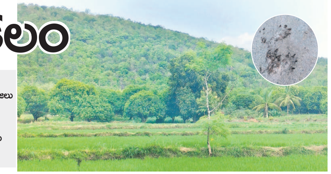
కోటగిరి మండలం నాగేంద్రపూర్ శివారులో ఉన్న అటవీప్రాంతం, ఇన్సైట్లో చిరుత పాదముద్రలు