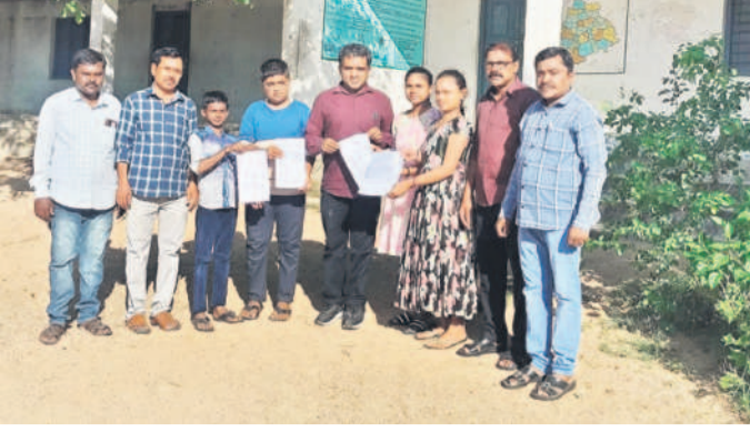
టీసీలను ప్రధానోపాధ్యాయుడికి అందజేస్తున్న ఉపాధ్యాయులు, వారి పిల్లలు