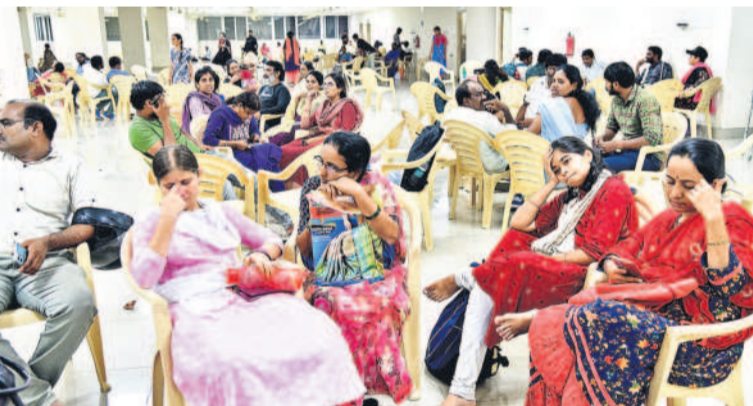
బుధవారం బంజారా హిల్స్ లోని బంజారా భవన్ లో నిర్వహించిన గురుకుల బదిలీల ప్రక్రియపై వాస్తవ జేతనల ఉద్యోగులు, ఉపాధ్యాయులు

శిక లేకుండా, ఇన్ఫారమేషన్ బదిలీల ప్రక్రియను నిర్వహిస్తున్నారని ఉద్యోగులు, ఉపాధ్యాయులు నిప్పులు చెరుగుతున్నారు. అన్ని సాస్టైబిల్, శాఖల్లో ఆన్ లైన్ బదిలీలే జరుగుతుండగా, సోపల్ వెల్ఫేర్ సాస్టైబిల్ మాత్రం ఆన్ లైన్ మాత్రమే మార్కులపై అభ్యంతరాలు, అనుమానాలు వ్యక్తం చేస్తున్నారు. కాగా, బంజారా హిల్స్ లోని సేవాలలో బంజారా భవన్ లో బదిలీలకు సంబంధించిన కొనసాగించే ప్రక్రియ రెండు రోజులూ కొనసాగుతున్నది. బుధవారం సైతం గ్రేడ్-2 ప్రిస్మాటర్స్, డిగ్రీ కాలేజీ స్టాఫ్ మిస