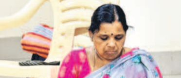
విన్నాళికి పాలుచదుతున్న ఓ ఉద్యోగి తల్లి

అధికారుల బదిలీలు చిన్నపిల్లల ఆటలా ఉన్నది. సీనియర్ అధికారులను కమిషనర్ రెండు మూడేండ్లుంటూ ఒక పోస్టింగ్లో ఉంచడం ఆనవాయితీ. అప్పుడే సదరు అధికారి పోస్టింగ్లో కుదురుకోని కొంత మెరుగైన పని తీరు కనబరచే అవకాశం ఉంటుంది. కానీ, రేవంత్ వచ్చాక అధికారులను పనిపట్టు బదిలీలు చేస్తున్నారు. దీంతో ఆ అధికారులు ఎక్కడా కుదురుకోలేకపోతున్నారు. ఎప్పుడూ ఉంటామని, ఎప్పుడూ పోతామని తెలియని గందరగోళంలో ఆ పిల్లలకు కూడా ఏ పనినీ సీనియర్ ఐఎస్ఎస్ అధికారులు లేదనే ఆరోపణలున్నాయి. రాష్ట్రంలో పాలన కూడా పూర్తిగా గాడితప్పుంది. ఇది రేవంత్ అనుభవరాహిత్యం, సీదను కూడా అనుమానించి వేస్తూనే ఉన్నావని అభ్యంతరం మరలకే కాదు. దీనివల్ల తెలంగాణలో పాలన మాత్రం కుంటుపడుతున్నది. -కొణత బిల్స్, బీఆర్ఎస్ నోడల్ మీడియా కమిషనర్