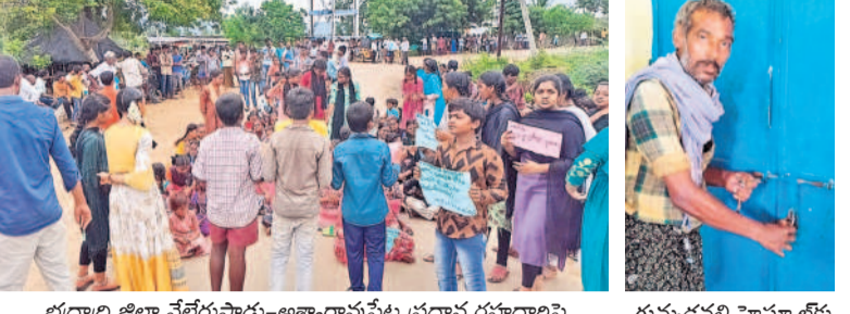
భద్రాద్రి జిల్లా వేలేపాడు-అక్కారాపేట ప్రధాన రహదారిపై ధర్నా చేస్తున్న విద్యార్థులు, వారి తల్లిదండ్రులు