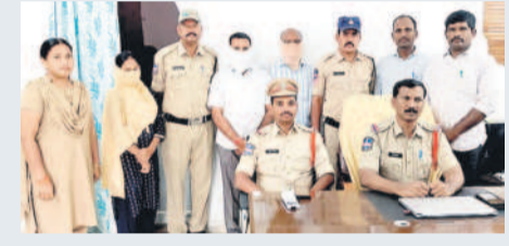
నిందితుల అరెస్ట్ వివరాలను వెల్లువెత్తుతున్న పోలీసులు

నిజానికి భూణహత్యలు జరిగినట్టుగా ఎక్కడ నుంచి సమాచారం వచ్చినా జిల్లా వైద్యారోగ్య శాఖ సూజాత్ తీసుకొని, తక్షణం బ్యూరోలను రంగంలోకి దింపాలి. సందర్భానకు వెళ్లి నిబ్బందిని వివరించాలి. నిజాలు నిర్ధారించుకొని తగిన చర్యలకు మైన చర్యలు తీసుకోవాలి. కానీ, ఆమె వైద్యారోగ్య శాఖలో కనిపించడం లేదు. నిజానికి ఈ విషయాన్ని డిపార్ట్ మెంట్ సీరియస్ గా తీసుకోవాలి. ఆమె పరిధిలోని జిల్లాలోనే భూణహత్య జరిగిందంటూ యువతి రాక పూర్వంగా ఫిర్యాదు చేసినట్లు.. ఆ సమాచారం సందర్భాన్ని పరిశీలించాలి. తగిన చర్యలు తీసుకోవాలి. సందర్భానకు వెళ్లి చర్యలు తీసుకోవాలి. కానీ, ఆ దిశగా చర్యలు తీసుకోకపోవడం అనుమానం తావిస్తున్నది. జమ్మికుంట, హుజూరాబాద్ కేంద్రంగా జరుగుతున్న భూణహత్యల వ్యవహారం