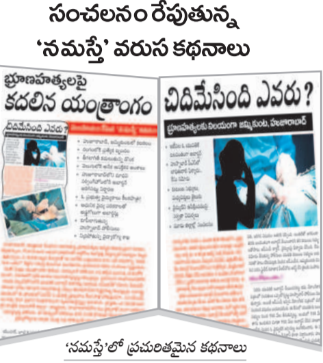
'నమస్తే'లో ప్రచురితమైన కథనాలు

జమ్మికుంట, హుజూరాబాద్ కేంద్రంగా వెలుగులోకి భూణహత్యలు