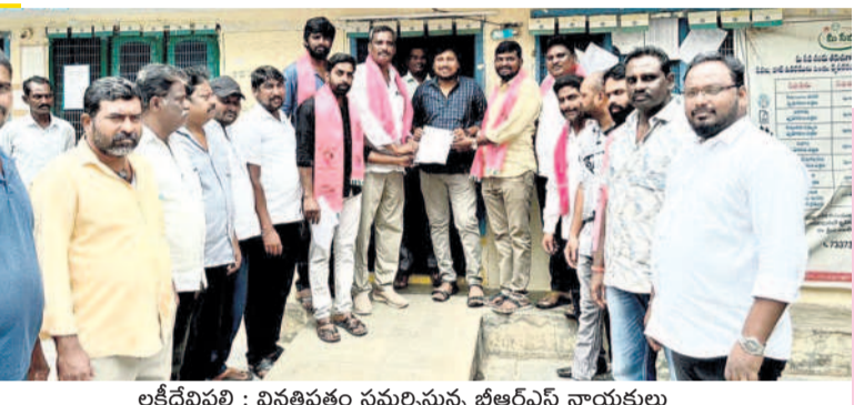
లక్ష్మీవేలిపల్లి : వినతిపత్రం సమర్పిస్తున్న బీఆర్ఎస్ నాయకులు