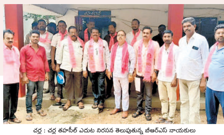
చద్ర : చద్ర తహసీల్ ఎదుట నిరసన తెలుపుతున్న బీఆర్ఎస్ నాయకులు