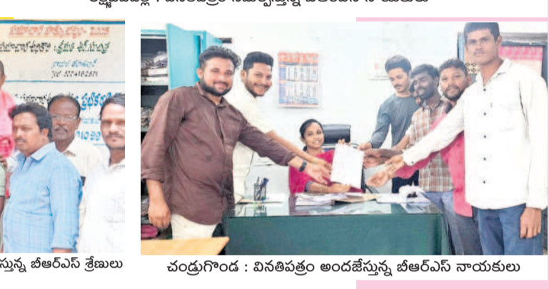
చంద్రగోండ : వినతిపత్రం అందజేస్తున్న బీఆర్ఎస్ నాయకులు