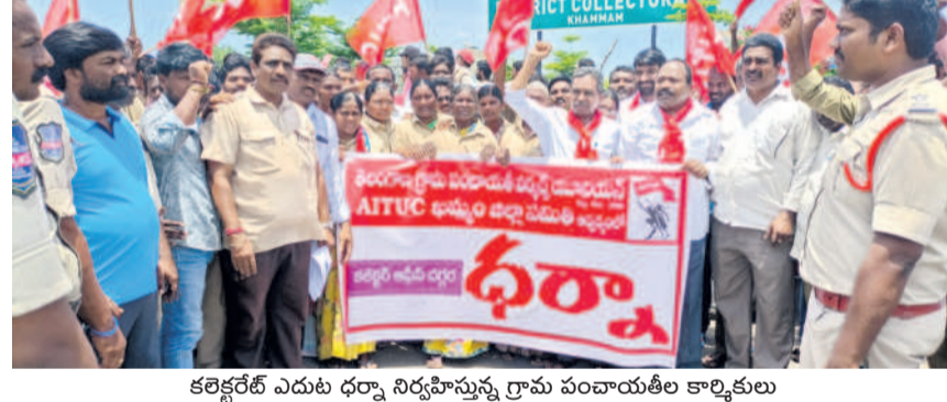
కలెక్టరేట్ ఎదుట ధర్మా నిర్వహిస్తున్న గ్రామ పంచాయతీల కార్మికులు

కలెక్టరేట్ ఎదుట గ్రామ పంచాయతీల కార్మికుల ధర్మా