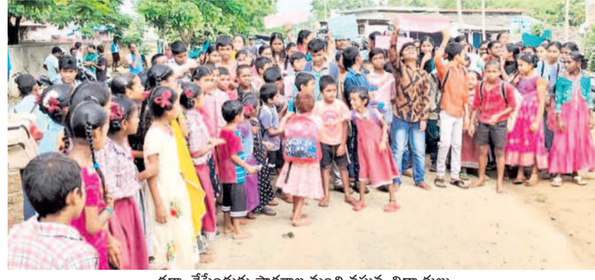
ధర్మా చేసేందుకు పాఠశాల నుంచి వస్తున్న విద్యార్థులు