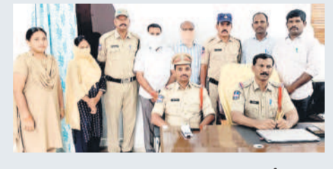
నిందితుల అరెస్ట్ వివరాలను వెల్లడిస్తున్న పోలీసులు

నిజానికి భూణహత్యలు జరిగినట్లుగా ఎక్కడ నుంచి సమాచారం వచ్చినా జిల్లా వైద్యారోగ్యశాల సుమోటింగ్ తీసుకొని, కేసులు బృందాలను రంగంలోకి దింపాలి. సదరు దవాఖానం వెళ్లి నిబ్బందిని విచారించాలి. నిజాని రిపోర్టులను తీసుకుంటున్న మైన చర్యలు తీసుకోవాలి. కానీ, అవేమీ వైద్యారోగ్యశాలలో కనిపించడం లేదు. నిజానికి ఈ విషయాన్ని డీహెచ్ఎంఎం సీరియస్ గా తీసుకోవాలి. ఆమె పదిలోని జిల్లాలోనే భూణహత్య జరిగిందంటూ యువతి తండ్రి తండ్రిగా కోరారు. ఆ సమాచారం సదరు పోలీస్ స్టేషన్ నుంచి తెలుసుకోవాలి. సదరు దవాఖానంపై చర్యలు తీసుకోవాలి. కానీ, ఆ దిశగా చర్యలు తీసుకోకపోవడం అనుమానాలకు తావిస్తున్నది. జమ్మికుంట, హుజూరాబాద్ కేంద్రంగా జరుగుతున్న భూణహత్యల వ్యవహారం మూడు రాష్ట్రాలకు విస్తరించడం, అక్కడి గర్భిణులను తీసుకోవచ్చి ఇక్కడ అబార్న్లు చేయిస్తున్న నేపథ్యంలో స్థానిక పోలీసులు చర్య వేక్షణ సైకిల్ ఏమవుతుందన్న ప్రశ్నలు ఉత్పన్నమవుతున్నాయి. ఈ విషయంపై స్థానిక పోలీసులు ఇప్పటికైనా ప్రత్యేక దృష్టిపెట్టడంతో పాటు జయశంకర్ భూపాలపల్లి చెందిన ఏజెంట్ నడుపుతున్న దండాకు అడ్డుకట్ట వేయాల్సిన అవసరముందన్న అభిప్రాయాలు వ్యక్తమవుతున్నాయి.