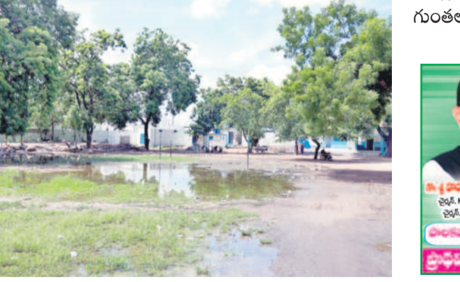
ప్రభుత్వ పాఠశాల ఆవరణలోని మైదానంలో నిలిచిన వర్షపు నీరు