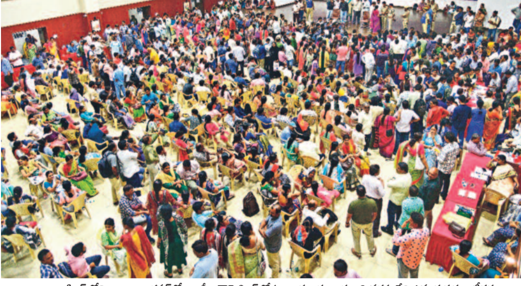
బంజారా హిల్స్ లోని బంజారా భవన్ లో బదిలీ కోసం బుధవారం అర్ధరాత్రి వరకు వేచి ఉన్న గురుకుల బీచర్లు

కాన్సెలింగ్ తీరుపై టీచర్ల ఆగ్రహం అర్ధరాత్రి వరకు సాగిన ఆందోళన పోలీసుల రంగప్రవేశంతో ఉద్రిక్తత