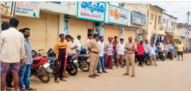
వాహనాలను తనిఖీ చేస్తున్న ఎమ్మెల్యే జగన్మోహన్

లింగాల, జూలై 9: మండల కేంద్రంలో నెంబర్ ఫ్లైట్ లేని ద్విచక్ర వాహనాలను ఎమ్మెల్యే జగన్మోహన్ ఆధ్వర్యంలో మంగళవారం సీజ్ చేశారు. ఈ సందర్భంగా ఎమ్మెల్యే జగన్మోహన్ మాట్లాడుతూ ఎన్ని ఆదేశాల మేరకు మండల కేంద్రంలో సైజ్ చేసిన