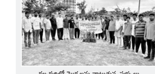
కల్వకుర్తిలో మొక్కలను నాటుతున్న సభ్యులు