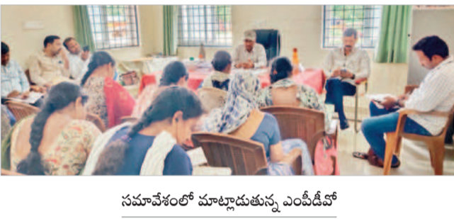
సమావేశంలో మాట్లాడుతున్న ఎమ్మెల్యే

బిజినెస్ లి, జూలై 9: పంచాయతీ కార్యదర్శులు తమకు కేటాయించిన గ్రామాల్లో ప్రతినిత్యం అందుబాటులో ఉండాలని ఎమ్మెల్యే ఖతాబద్దె అన్నారు. మంగళవారం మండల కేంద్రంలో ఆయన ఛాంబర్లో పంచాయతీ కార్యదర్శులతో సమావేశం నిర్వహించారు. ప్రస్తుత పర్యటన కాలం ఉన్నందున పారిశుధ్యం లోపించ