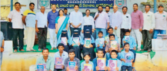
విద్యార్థులు పాఠ్యపుస్తకాలు పంపిణీ చేస్తున్న ఎమ్మెల్యే రాజేశ్వరి

నాగర్ కర్నూల్, జూలై 9: పేద విద్యార్థులకు విద్యను అందించడమే లక్ష్యంగా ప్రభుత్వం కృషి చేస్తుంది ఎమ్మెల్యే రాజేశ్వరి అన్నారు. మంగళవారం స్థానిక ప్రభుత్వ బాలబడి జూనియర్ కళాశాలలో సూతనంగా ప్రవేశం పొందిన విద్యార్థులకు ఉచితంగా పాఠ్యపుస్తకాలను అందజేశారు. ఈ సందర్భంగా ముఖ్యమంత్రి జిల్లా కేంద్రంలో దాదాపు 500 పైగా ప్రవేశాలతో బడుగు, బలహీన వర్గాల విద్యార్థులు విద్యనభ్యస