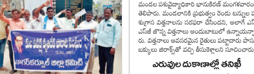
నల్లవెల్లి కూడలిలో ధర్మా చేస్తున్న సభ్యులు