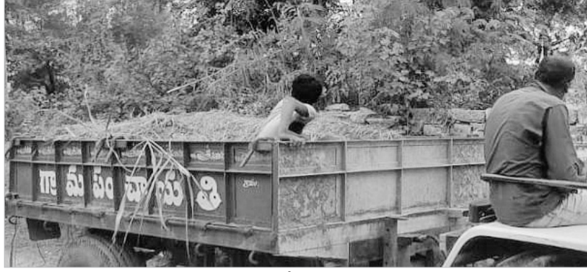
గ్రామ పంచాయతీ ట్రాక్టర్లో పశుగ్రాసం తీసుకొస్తున్న దృశ్యం

వంగూరు, జూలై 9: గ్రామీణ పల్లెల పరిశుభ్రంగా ఉంచుకోవాలనే ఉద్దేశంతో గత బీఆర్ఎస్ ప్రభుత్వం ప్రతి గ్రామపంచాయతీకి ట్రాక్టర్లను మంజూరు చేసింది. ట్రాక్టర్లతో పాటు ట్రాల్లీ, ట్యాంకర్, డోజర్ సహాయంతో కూడిన ఇంజనీ వచ్చాయి. గ్రామ అభివృద్ధికి ట్రాక్టర్లను వినియోగించుకోకుండా సొంత అవసరాలకు కొందరు నేతలు వాడుకుంటున్నారు. మండలంలోని కోనేటిపూర్ గ్రామంలో అధికార పార్టీకి చెందిన ఓ నేత గ్రామ పంచాయతీకి చెందిన ట్రాక్టర్, ట్రాల్లీ, ట్యాంకర్లను తమ సొంత పనుల కోసం వాడుకుంటున్నట్లు గ్రామస్థులు ఆరోపిస్తున్నారు. సదరు నేతకు చెందిన బలెల పెద్దలతో వాటి కోసం సత్వం ట్యాంకర్ ద్వారా తొట్టోకి నీటిని తీసుకురావడంతోపాటు ట్రాల్లీలో పశుగ్రాసం తీసుకొస్తూ తమ సొంత పనులకు వాడుకోవడం ఏమీటని గ్రామస్థులు ప్రశ్నిస్తున్నారు. గ్రామభివృద్ధికి వాడుకోవాల్సిన ట్రాక్టర్లను అధికారుల నిర్లక్ష్యంతో ఆ నేత సొంత పనులకు వాడుకోవడం అధికారులకు కనిపించడం లేదా