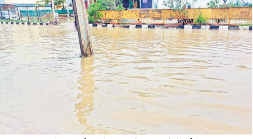
ములుగు జాతీయ రహదారిపై భారీగా నిలిచి ఉన్న వరద నీరు

మద్యం వినియోగం పెరుగుతుండడంతో సమాజంలోని చాలా అంశాలపై ప్రతికూల ప్రభావం పడుతున్నది. పేద ఆర్థిక పుష్ప, ఆరోగ్యం దెబ్బతినడంతో పాటు శాంతిభద్రతల విషయంలో ఎక్కువగా సమస్యలు వస్తున్నాయి. ప్రభుత్వం అనుమతి ఇచ్చిన షాపులకు తోడుగా బెల్ట్ షాపులు ఉండడంతో ఎక్కడపడితే అక్కడ, ఎప్పుడు పడితే అప్పుడు మద్యం అందుబాటులో ఉంటున్నది. అర్ధరాత్రి కూడా యెట్టిగా మద్యం అమ్మకాలు జోరూగా సాగుతున్నాయి. మద్యం వినియోగం పెరగడం వల్ల మద్యం, కుటుంబ పంచాయితీలు పెరుగుతున్నాయి. మహిళలు, పిల్లలపై అపరాధాలు లకు ప్రధానంగా మద్యమే కారణమవుతున్నది.