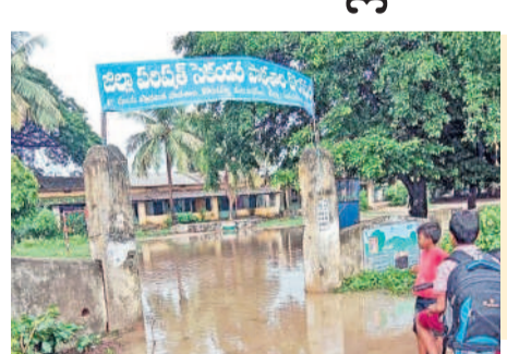
బస్చోలు : జలమయమైన కొండపల్లి జడ్చీ పాఠశాల

బస్చోలు, జూలై 8 : మండలంలోని కొండపల్లి గ్రామంలోని జడ్చీ పాఠశాల రాత్రి కురిసిన వర్షాల వల్ల నీరు నిండిపోయింది. పాఠశాలకు వచ్చిన చిన్న పిల్లలు తిరిగి ఇంటికి వెళ్లడంతో విషయం తెలుసుకున్న పాఠశాల అధికారులు పాఠశాల వద్దకు వెళ్లి దింపి వచ్చారు. స్థానిక ఎమ్మెల్యే వెంటనే స్పందించి కొండపల్లి పాఠశాలకు వచ్చిన పిల్లలను తీసుకు వెళ్లి ఇంటికి పంపిస్తామని ప్రకటించారు. అంతే కాకుండా పాఠశాలకు వచ్చిన పిల్లలకు తప్పనిసరిగా తిండి పంపిస్తామని ప్రకటించారు. అంతే కాకుండా పాఠశాలకు వచ్చిన పిల్లలకు తప్పనిసరిగా తిండి పంపిస్తామని ప్రకటించారు.