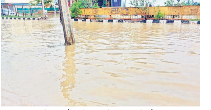
ములుగు జాతీయ రహదారిపై భారీగా నిలిచి ఉన్న వరద నీరు

భద్రకాళి శాకంబరీ నవరాత్రోత్సవాల కనుల పండువగా జరుగుతున్నాయి. మూడో రోజు సోమవారం ఉదయం అమ్మవారు కుల్లా క్రమంలో, సాయంత్రం నిత్యక్షిన్నా అలంకారంలో భక్తులకు దర్శనం, ప్రధాన అర్చకుడు భద్రకాళి శేష అమ్మవారికి ఉదయం సుప్రతాప సేవ, నిత్యా హ్నికం, క్షీరాన్నం నివేదించారు. - వరంగల్, జూలై 8