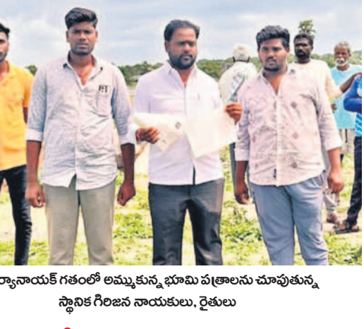
పూర్వ నాయకుల గతంలో అమ్ముకున్న భూమి పట్టాదారుల దుబాబుకు, రైతులు స్థానిక గిరిజన నాయకులు, రైతులు