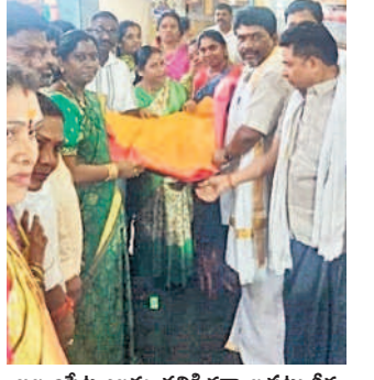
అమ్మవారికి గద్వాల పట్టుచీర లండన్ సెస్టు జములమ్మ అలయ కమిటీ