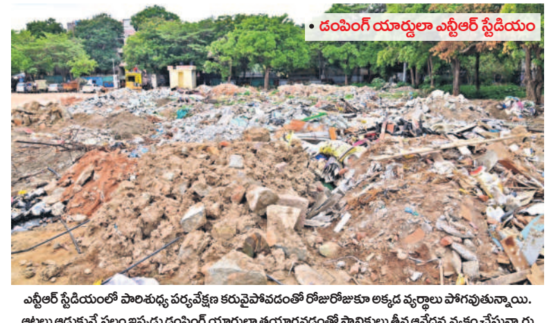
వ్యతిరేక స్థితిలో పారిశుధ్య పర్యవేక్షణ కర్మవైఫల్యంతో రోజురోజుకూ అక్కడ వ్యర్థాలు పోగుతున్నాయి. అటుకాదుకునే స్థలం ఇప్పుడు దంపింగ్ యార్డులా తయారవడంతో స్థానికులు తీవ్ర ఆవేదన వ్యక్తం చేస్తున్నారు

I హైదరాబాద్, మంగళవారం 9 జూలై 2024 HYDERABAD