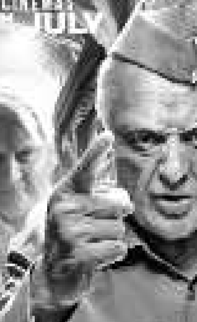
ఈనెల 12న బ్రహ్మాండమైన విడుదల