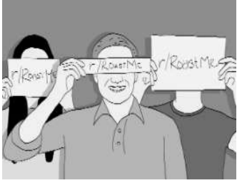
రోస్టింగ్ చేసిన వారిపై కేసులు నమోదు చేసినట్లు తెలుస్తోంది.

హైదరాబాద్, జూలై 8 (నమస్తే తెలంగాణ): ఆన్లైన్ రోస్టింగ్ ముగిసిన తర్వాత రోస్టింగ్ చేసిన వారిపై కేసులు నమోదు చేసినట్లు తెలుస్తోంది.