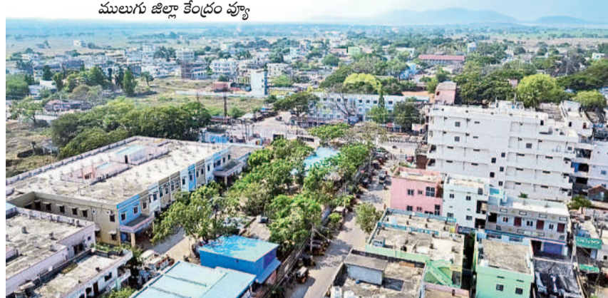
ములుగు జిల్లా కేంద్రం వ్యూ