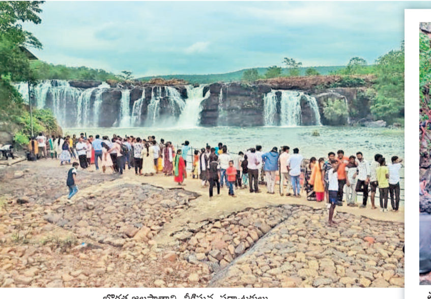
బోగత జలపాతాన్ని వీక్షిస్తున్న పర్యాటకులు