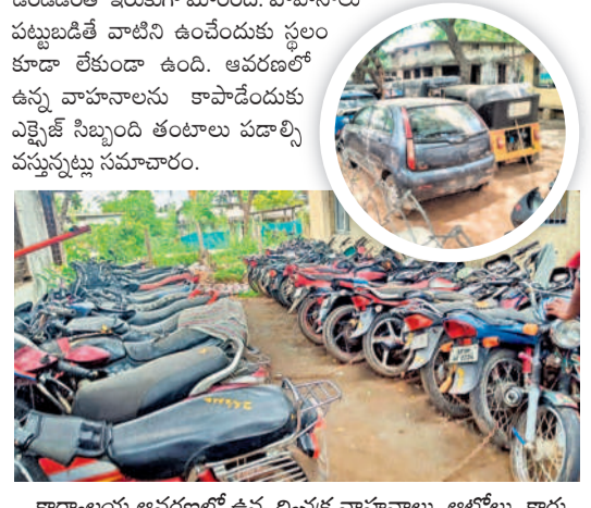
కార్యాలయ ఆవరణలో ఉన్న ద్వితీయ వాహనాలు, అటోలు, టాటా

వేలం ఎప్పుడో ? ■ ఎక్స్ కే కార్యాలయంలో కుప్పకూలు వాహనాలు ■ తుమ్మపాడుకున్న వట్లించుకొని అధికారులు ఏటూరునాగారం, జూలై 7 : ఏటూరునాగారం, మంజుపేట, వాజేడు, వెంకటాపురం మండలాల్లో గుడంబా, మధ్య రహదారిలో చట్టబద్ధ వాహనాలతో ఎక్స్ కే కార్యాలయం ఆవరణ నిండిపోయింది. కొన్ని నెలలుగా ద్వితీయ వాహనాలు, అటోలు, టాటా మ్యాజిక్ లను కార్యాలయానికి తరలించారు. అయితే ఈ వాహనాలపై కేసులు నమోదు చేసిన అధికారులు గడువు ముగిసిన తర్వాత వాటిని వేలం వేసి అమ్ముతుంటారు. వాటిని అధికారులు పరిశీలింపి, ధర నిర్ణయించాలి ఉంటుంది. కొద్ది కాలంగా ఎక్స్ కే అధికారులు వేలం పాటు నిర్వహించకపోవడంతో సుమారు 50 వరకు ద్వితీయ వాహనాలు, ఇతర వాహనాలు 20కి పైగా ఉన్నాయి. ప్రస్తుతం ఉన్న కార్యాలయం ఆవరణ తక్కువగా ఉండడంతో ఇరుకుగా మారింది. వాహనాలు చుట్టూరేపి వాటిని ఉంచేందుకు స్థలం కూడా లేకుండా ఉంది. ఆవరణలో ఉన్న వాహనాలను కాపాడేందుకు ఎక్స్ కే సిబ్బంది తంటాలు పడాలి వస్తున్నట్లు సమాచారం.