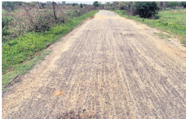
అధ్యానంగా మారిన లోంకలపల్లి - లింగంపేట రోడ్డు