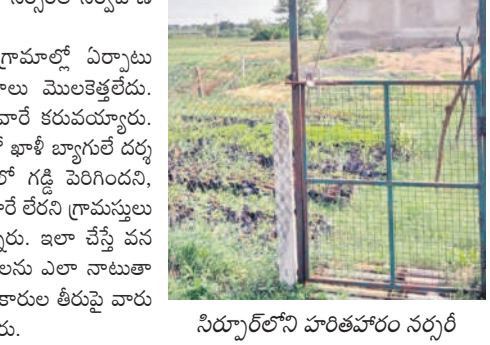
సిర్సార్ లోని హరితహారం నర్సరీ

కార్యదర్శుల నిర్లక్ష్యంతో నర్సరీల నిర్వహణ అధ్యానంగా మారింది. మండలంలోని పలు గ్రామాల్లో ఏర్పాటు చేసిన నర్సరీల్లో విత్తనాలు మొలకెత్తలేదు. అయినా పట్టించుకునే వారే కరువయ్యారు. సిర్సార్ గ్రామ నర్సరీలో ఖాళీ బ్యాగులే దర్శనమవుతున్నాయి. నర్సరీలో గడ్డి పెరిగింది, అయినా పట్టించుకునే వారే లేరని గ్రామస్థులు ఆవేదన వ్యక్తం చేస్తున్నారు. ఇలా చేస్తే వన చక్కటి వాతావరణాన్ని పంచుకున్నాయి. పల్లె రని ప్రశ్నిస్తున్నారు. అధికారుల తీరుపై వారు ఆగ్రహం వ్యక్తం చేస్తున్నారు.