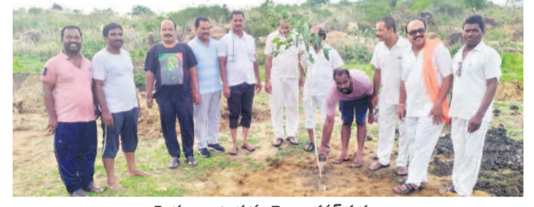
మొక్కలు నాటుతున్న యోగా భవన్ సభ్యులు