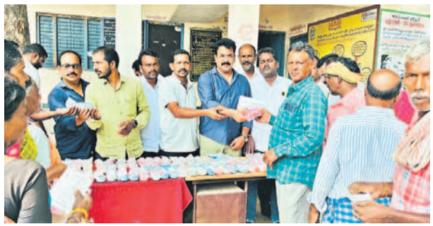
కండ్ల అడ్డాల పంపిణీ చేస్తున్న శ్రీనివాస్ వైద్య కేంద్రం