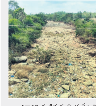
ఎడారిని తలపిస్తున్న లింగంపేట పెద్దవారి