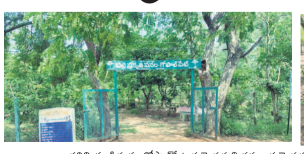
అడవిని తలపిస్తున్న గోపాలపేట పల్లె ప్రకృతి వనం, పల్లె ప్రకృతివనంలో ధ్వంసమైన సిమెంట్ బల్లలు

● పెరిగిన పిచ్చిమొక్కలు, గడ్డి ● విరిగినపోయిన బల్లలు నాగిరెడ్డిపేట, జూలై 7 : మండల కేంద్రం గోపాలపేట పల్లె ప్రకృతి వనంపై అధికారులు నిర్లక్ష్యం చూపుతున్నారు. గోపాలపేట ఉన్న షా తలసాల్ స్థలంలో పల్లె ప్రకృతి వనాన్ని ఉద్ధరించుకోవడానికి పనులు చేపట్టాలి అంటూ నాయకులు పనిచేస్తున్నారు. పచ్చని చెట్లు పెంచి, వనం చుట్టూ నడిచేయడం ద్వారా ఏర్పాటుచేశారు. దారికి ఇరువైపులా ఇటుకలతో అడ్డంగా