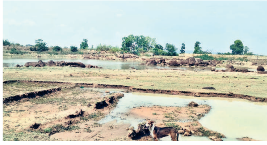
పూర్తిగా అడుగంటిన మెంగారం గ్రామ ఊరి చెరువు

లింగంపేట, జూలై 7 : వానకాలం ప్రాంతంపై నెల గడుస్తున్నా, సరైన వర్షాలు కురవక పోవడంతో జలాశయాలు నీరు లేక వెలవెపోతున్నాయి. జూలై మాసం మొదలై వారం రోజులు గడిచినా ఇప్పటివరకు పెద్ద వర్షం కురవలేదు. సకాలంలో వర్షాలు కురిస్తే పచ్చని పంట పొలాలతో కళకళలాడతూ ఉన్న భూములు బొగ్గా మారాయి. మండలంలోని 50కి పైగా చెరువులు, కుంటలు నీరు లేక బోసిపోయాయి. మండల రైతులు వర్షాధారంగా చెరువులపై ఆధారపడి పంటలు పండిస్తుంటారు. బోసుబావుల వద్ద కొద్ది మంది నాట్లు వేసినా.. ఎక్కువ శాతం