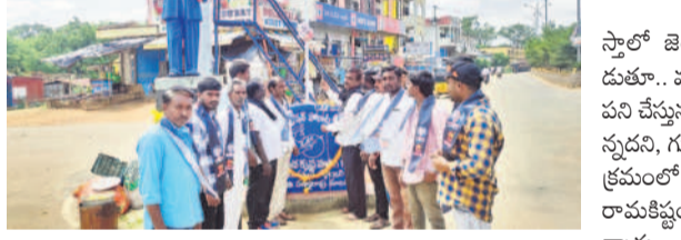
ఎల్లారెడ్డిలో జెండాను ఆవిష్కరిస్తున్న ఎమ్మార్పీఎస్ నాయకులు