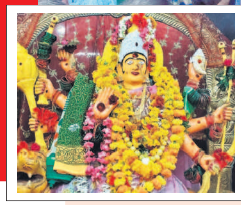
ఆర్కాడలో పూజలందుకున్న పెద్ద పోవమ్మ

ఉమ్మడి నిజామాబాద్ జిల్లాలో ఆషాఢ మాసం పూజలు ప్రారంభమయ్యాయి. గ్రామాలు, పట్టణాల్లో భోజనాల పండుగ భక్తి శ్రద్ధలతో నిర్వహిస్తున్నారు. తొలిరోజు ఆదివారం పురస్కరించుకొని పలు గ్రామాల్లో గోదావరి జలాలతో గ్రామదేవతల విగ్రహాలకు అభిషేకం నిర్వహించారు. దీంతో ఆలయాల వద్ద భక్తుల సందడి నెలకొన్నది. యూలలను బలిచ్చి కుటుంబసభ్యులతో కలిసి వసభోజనాలు చేశారు. - ఆర్కాడ/ముప్పాల్, జూలై 7