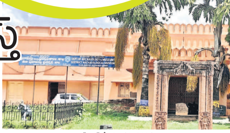
తిలకగార్డెన్ లోని పురావస్తు ప్రదర్శనశాల

విస్తారాలు, తల్లిదండ్రులు, ఉపాధ్యాయులు, చరిత్ర పరిశోధకులతో సందడిగా ఉండేది. 12 ఏండ్లుగా.. పురాతన భవనం కావడంతో వాసకాలంలో ఊరుస్తుండడంతో అపురూప గ్రంథాలు, ఆభరణాలు చెడిపోయే పరిస్థితి వచ్చింది. 2012 నుంచి పలు మరమ్మతుల వేరిబు ఇప్పటివరకు మూసే ఉంచారు. గత ఆరేండ్ల క్రితం రూ. 40 లక్షలు వెచ్చించి డింగ్ సున్నం, రంగులతో అభివృద్ధి చేశారు. అపురూప వస్తువులను ఉంచేందుకు అవసరమైన షోకేసులు ఏర్పాటు చేస్తామని అప్పటి అధికారులు చెప్పారన్నారు. పూర్తిస్థాయి సిబ్బంది లేకపోవడంతో మ్యూజియం అంతా దుమ్ము ధూళితో భయానకంగా తయారైంది. 2022లో అప్పటి కలెక్టర్ నారాయణ రెడ్డి ప్రదర్శనశాలను పరిశీలించి అధికారులకు తగు సూచనలు చేసి, అందుబాటులోకి తేవాలని సూచించారు. అయినా ఎక్కడవేసిన గొంగళి అక్కడే అన్న చందంగా అధికారులు స్పందించకపోవడంతో ఆంధ్రకాంత్, నిశ్శబ్ద వాతావరణంలో ఉన్నది. అధికారులు, ప్రజా ప్రతినిధులు పురావస్తు ప్రదర్శనశాలను తెరవేసి, అవసరమైన మౌలిక పనులు కల్పించి, ప్రజలకు అందుబాటులో ఉండేలా చర్యలు చేపట్టాలని నగరపాలకులు కోరుతున్నారు.