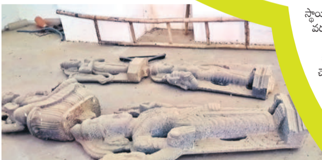
ప్రదర్శనశాలలో దుమ్ము పట్టిన శిల్పాలు

విద్యాశాఖలో జరుగుతున్న అవినీతి కంపు అధికార పార్టీకి తలపంపుగా మారుతున్నది. ఈ పరిస్థితిపై పలువురు టీచర్లు తమ గోడును అధికార పార్టీకి చెందిన ప్రజా ప్రతినిధులతో చెప్పుకున్నారు. ఇలాంటి బేరాలు సరికాదని, సడలు అధికారులపై చర్యలు తీసుకోవాలని సందేశాలు పంపించారు. కానీ అవినీతి దండం అగణనీయంగానే ఆశ్రయానికి గురి చేస్తున్నది. పలువురు టీచర్లు మరో ఆడుగు ముందుకొస్తే యూనియన్ నేతలకు ఫోన్లు చేసే కామారెడ్డి, ఎల్లారెడ్డి, బాన్సువాడ నియోజకవర్గాల్లో జరుగుతున్న తంతుప్ప వివరంగా వివరాలు చెప్పారు. కానీ వారు కూడా చేతులెత్తేదంతో టీచర్లు బాధితులుగానే మారిపోవచ్చు వస్తున్నది. యూనియన్ నేతలను ఆశ్రయించిన టీచర్ల వివరాలు లీక వ్వడంతో వారిని కక్ష కట్టి మరీ ఎంఈఎల్ వేదిస్తుండడం విచిత్రంగా మారింది. డొయం డొందే అన్వేషణ కఠినీతుల వలపులు ఉపాధ్యాయి నాయకులు అండగా నిలువడం చర్చనీయాంఠం అవుతున్నది. ముఖ్యంగా కామారెడ్డి నియోజకవర్గాల్లో ఈ వేదింపులు తారాస్థాయికి చేరుకున్నాయి సమాచారం. ఇక్కడ తీవ్ర వేసకొని కూర్చున్న ఓ అధికారి బహిరంగంగానే ఈ చేతులు స్థాయి తారాస్థాయికి చేరుకున్నాయి సమాచారం. ఇక్కడ తీవ్ర వేసకొని కూర్చున్న ఓ అధికారి బహిరంగంగానే ఈ చేతులు స్థాయి తారాస్థాయికి చేరుకున్నాయి సమాచారం. కామారెడ్డి జిల్లా విద్యాశాఖ అధికారి పలు ఫిర్యాదులు వెళ్లినట్లు తెలుస్తున్నది. కానీ డీఈవో స్థాయిలోనూ నిర్లక్ష్యమే సమాధానం రావడంతో డోపిడీకి అడ్డూ అడుపు లేకుండా పోయిందన్న వాదన వినిపిస్తున్నది. ఈ విషయంపై కామారెడ్డి డీఈవో రాజాను వివరణ కోసం నమస్తే తెలంగాణ సంప్రదించగా స్పందించేందుకు నిరాకరించారు.