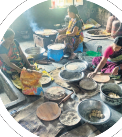
11:30 గంటలకు అల్పాహారం కోసం చూసేటటు చేస్తున్న వంట నిబ్బంది

అందించలేదు. ఆదివారం సందర్భం సమయం కావడంతో పాఠశాలకు వెళ్లిన విద్యార్థులను తల్లిదండ్రులు గుర్తించి స్థానిక విశ్రాంతి సమూహం ద్వారా దీంతో వెళ్ల చూడగా ఆరు, ఏడు, ఎనిమిదో తరగతుల విద్యార్థులకు అల్పాహారం అందగా తొమ్మిది, పదో తరగతి విద్యార్థులకు అందడం లేదని విద్యార్థినులు అందరూ చర్చనలో నిలుస్తున్నారు. చంటు మనుషులు అలస్యంగా వస్తుండడంతో ప్రతి రోజూ అల్పాహారం సమయానికి అందడం లేదని విద్యార్థినులు అందరూ చర్చనలో నిలుస్తున్నారు. అదివారం విచ్చేసిన వందేతి.. ఒక ముక్క వేసి రసం వేస్తున్నారని, తిరిగి అడిగితే తిడుతున్నారని నాచోపయోగం. అన్నానికి సరిపడా కూరలు వేయడం లేదని తెలిపారు. ఈ విషయంపై ఇన్చార్జి ఉపాధ్యాయుని రాకను వివరించారు. తాను ఉదయం 10 గంటలకు వచ్చానని తెలిపారు. రాత్రి దూర్గాల్లో ఉన్న ఉపాధ్యాయుని సర్కర్ అల్పాహారం పూర్తి చేయించి వెళ్లాలన్నారు. కానీ ఈ రోజు చంటు నిబ్బంది అలస్యంగా రావడంతో విద్యార్థులకు సమయానికి అల్పాహారం అందించలేదని తెలిపారు. విషయాన్ని ప్రత్యేక అధికారికి వీణకు తెలియజేశామన్నారు. పాఠశాల ప్రత్యేక అధికారికి వీణను ఫోన్లో సంప్రదించగా అగంటలో ప్రతి విద్యార్థినికీ అల్పాహారం అందిస్తామన్నారు. నిర్లక్ష్యాటల వరకు అల్పాహారం అందించాలి ఉండగా నిబ్బంది 9 గంటలకు వంట పనులు ప్రారంభించారు. ఉదయం 11 గంటలు దాటినా వారికి అల్పాహారం చేస్తున్న వంట నిబ్బంది