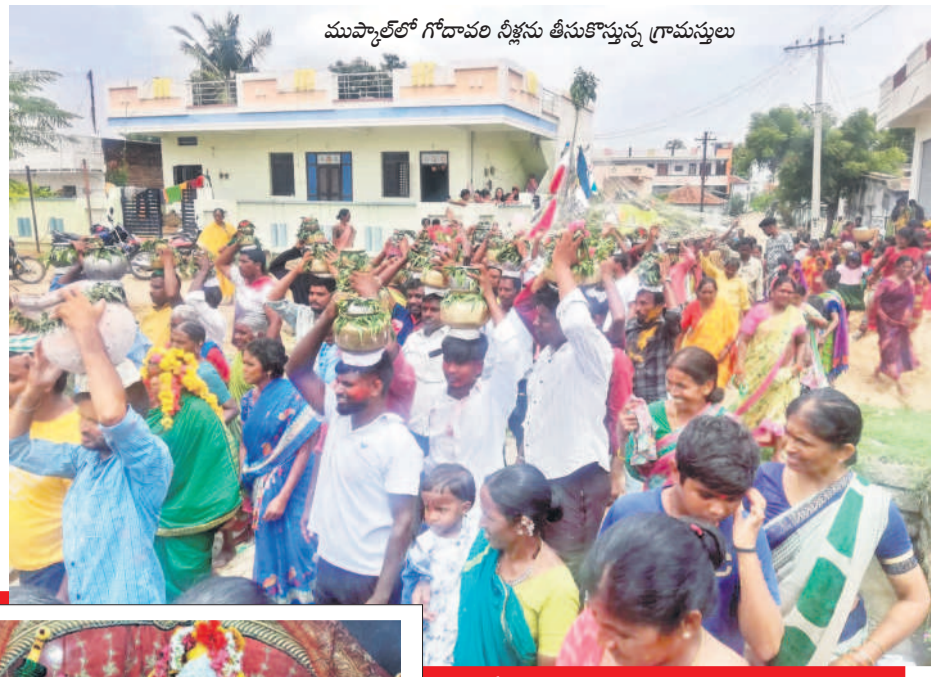
ఆచారం ప్రజలు ఘటం

ఉమ్మడి నిజామాబాద్ జిల్లాలో ఆషాఢ మాసం పూజలు ప్రారంభమయ్యాయి. గ్రామాలు, పట్టణాల్లో భోజనాల పండుగ భక్తి శ్రద్ధలతో నిర్వహిస్తున్నారు. తొలిరోజు ఆదివారం పురస్కరించుకొని పలు గ్రామాల్లో గోదావరి జలాలతో గ్రామదేవతల విగ్రహాలకు అభిషేకం నిర్వహించారు. దీంతో ఆలయాల వద్ద భక్తుల సందడి నెలకొన్నది. యూలలను బలిచ్చి కుటుంబసభ్యులతో కలిసి వసభోజనాలు చేశారు. - ఆర్కాడ/ముప్పాల్, జూలై 7