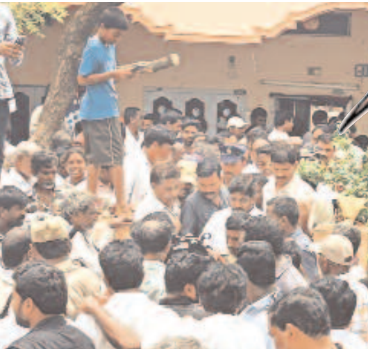
ప్రభుత్వ అత్యున్నత కేసులో నిందితుడైన కిశోర్ ఇంట్లో సమావేశం అనంతరం బయటకు వస్తున్న డిప్యూటీ సీఎం భట్టి విక్రమార్య