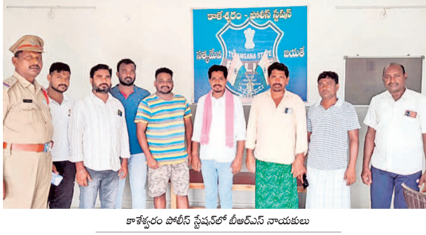
కాశీకేంద్రం పోలీస్ స్టేషన్లో బీఆర్ఎస్ నాయకులు