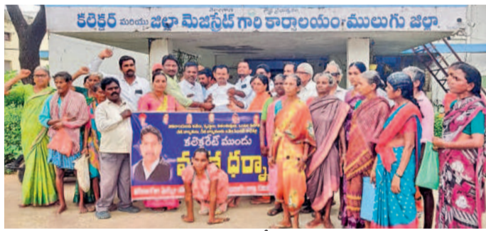
ములుగు కలెక్టరేట్ ఎదుట ధర్నా చేస్తున్న బీజేపీఎస్సీ నాయకులు, విద్యార్థులు, వృద్ధులు