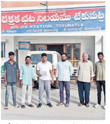
టేకమట్ల : ముందస్తు అరెస్టు అయిన నాయకులు

ఉమ్మడి వరంగల్ జిల్లా వ్యాప్తంగా చలువురు బీఆర్ఎస్, బీఆర్ఎస్, బీజేపీ, బీజేపీ, ఇతర విద్యార్థి సంఘాల నాయకులు, కార్యకర్తలను ఎక్కడిక్కడ అరెస్టు చేశారు. పథకం ప్రకారం గురువారం అర్ధరాత్రి ఇక్కడికి వెళ్లి ఆరు పులోకి తీసుకున్నారు. తెల్లవారుజాము పోలీస్ స్టేషన్లకు తరలించారు. మువ్వారం వరకు సొంత పూజారీత్వం ఏడవల చేశారు. ఈ సందర్భంగా నాయకులు మాట్లాడుతూ జీసీ 317, 46ను తీసివేయాలని డిమాండ్ చేశారు. అరెస్టులతో ఉద్యమాన్ని ఆపలేరని, జాబ్ క్యాలెండర్, ఉద్యోగ నోటిఫికేషన్లు వేసేవరకూ పోరాటం చేస్తామన్నారు. కాంగ్రెస్ ప్రభుత్వం అబద్ధ పాటలతో అధికారంలోకి వచ్చి ఏడు నెలలైనా జాబ్ క్యాలెండర్ రూపొందించలేదన్నారు.