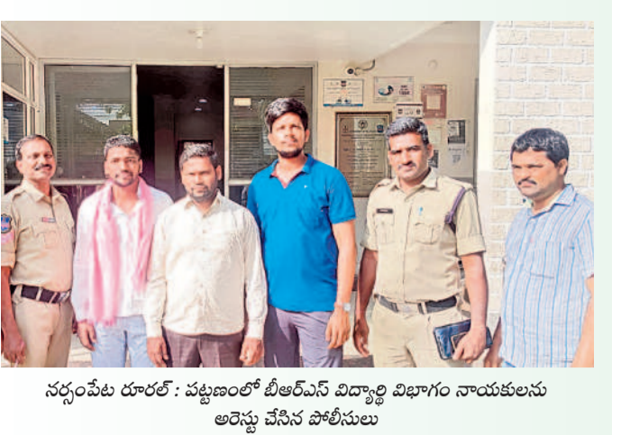
నర్సంపేట రూరల్ : పట్టణంలో బీఆర్ఎస్ విద్యార్థి విభాగం నాయకులను అరెస్టు చేసిన పోలీసులు

మానుకోట జిల్లాలో 26 మంది అరెస్టు మహబూబాబాద్, జూలై 5 (నమస్తే తెలంగాణ) : బీజేపీఎస్సీ ముట్టడికి వెళ్తున్న యువ తన పోలీసులు ఎక్కడిక్కడ నిర్బంధించారు. శుక్రవారం తెల్లవారుజాము నుంచి మహబూబాబాద్ జిల్లాలోని రైల్వేస్టేషన్లు, బస్ స్టేషన్లు, రోడ్డు మార్గాల వెళ్లినప్పుడు వద్ద మొత్తం 28 మంది యువకులను అరెస్టు చేశారు. తమ న్యాయమైన డిమాండ్ కోసం శాంతియుతంగా ధర్నా చేసేందుకు వెళ్తున్న వారిని అడ్డుకోవడంపై సర్కారు ఆగ్రహం వ్యక్తమైంది.