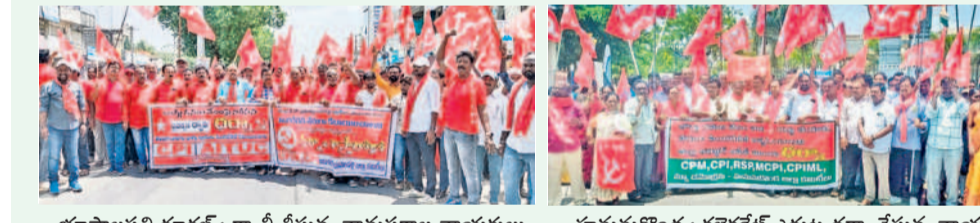
భూపాలపల్లి రూరల్ : ర్యాల్ తీస్తున్న వామపక్షాల నాయకులు