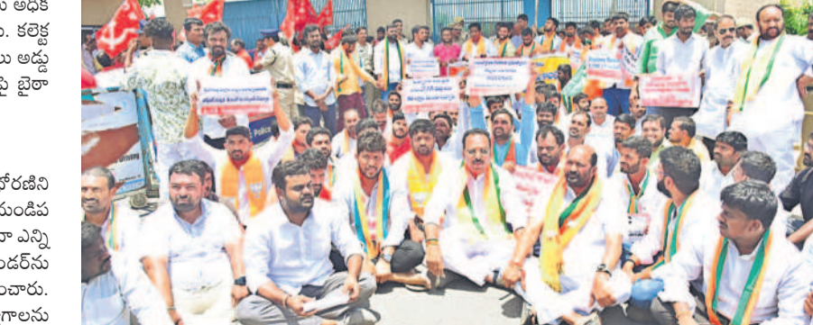
రంగారెడ్డి కలెక్టరేట్ ఎదుట బీజేపీవే ఎంధర్నాలో నిరసన

● రంగారెడ్డి కలెక్టరేట్ ఎదుట బీజేపీవే ఎంధర్నా ● ఆ కార్యాలయం ముట్టడికి యత్నం.. అడ్డుకున్న పోలీసులు