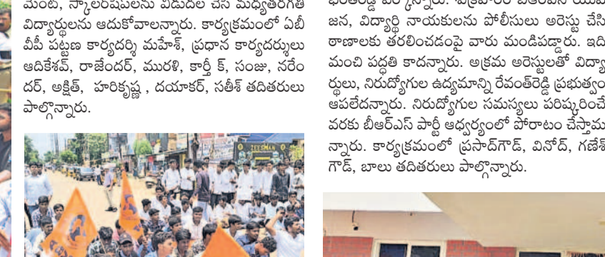
వికారాబాద్లో ధర్నా చేస్తున్న ఏబీవీవీ నాయకులు