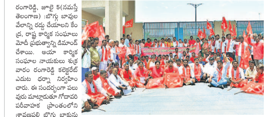
ధర్నా చేస్తున్న వివిధ సంఘాల నాయకులు

కలెక్టరేట్ ఎదుట కేంద్ర, రాష్ట్ర కార్మిక సంఘాల ఆధ్వర్యంలో ధర్నా