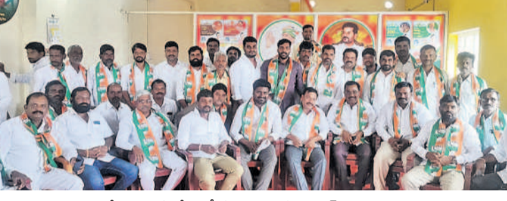
విలేజరుల సమావేశంలో మాట్లాడుతున్న కాంగ్రెస్ పార్టీ నాయకులు