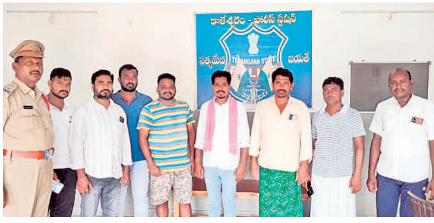
కాశీకేంద్రం పోలీస్ స్టేషన్లో బీఆర్ఎస్ నాయకులు