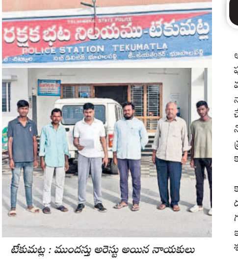
టీకమట్ట : ముందస్తు అరెస్టు అయిన నాయకులు