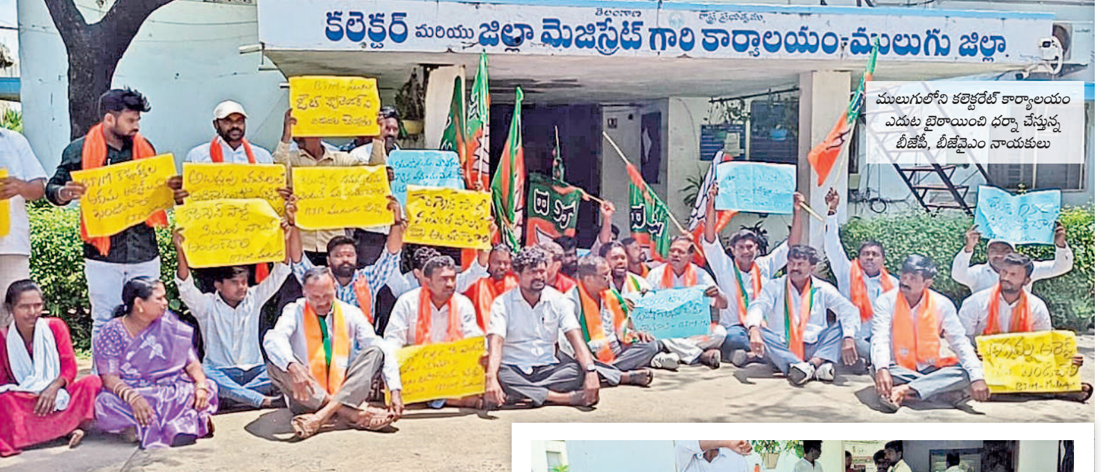
కలెక్టరేట్ ముట్టడికి కలెక్టరేట్ కార్యాలయం ఎదురు బొటానించి ధర్మా చేస్తున్న బీజేపీ, బీజేపీవైఎం నాయకులు

మానుకోట జిల్లాలో 26 మంది అరెస్టు మహబూబాబాద్, జూలై 5 (నమస్తే తెలంగాణ): బీజేపీఎస్సీ ముట్టడికి వెళ్తున్న యువ తన పోలీసులు ఎక్కడికక్కడ నిర్బంధించారు. శుక్రవారం తెల్లవారజాము నుంచి మహబూబాబాద్ జిల్లాలోని రైల్వేస్టేషన్లు, బస్ స్టేషన్లు, రోడ్డు మార్గాల వెళ్తున్న వ్యక్తులపై 28 మంది యువకులను అరెస్టు చేశారు. తమ న్యాయమైన డిమాండ్ కోసం శాంతియుతంగా ధర్మా చేసేందుకు వెళ్తున్న వారిని అడ్డుకోవడంపై సర్కారు ఆగ్రహం వ్యక్తమైంది.