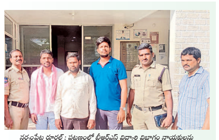
సర్పంచుల దూరలో: పట్టణంలో బీఆర్ఎస్ విద్యార్థి విభాగం నాయకులను అరెస్టు చేసిన పోలీసులు