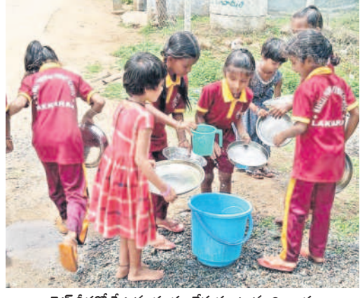
బాలికల స్నేహితుల ప్లేట్లను శుభ్రం చేసుకుంటున్న విద్యార్థులు

అదేశాలు ఇచ్చి ఆపివేసే? పంచాయతీ ఎన్నికల ఎప్పుడొచ్చిందో.. వాటిని సమర్థవంతంగా నిర్వహించేందుకు సిద్ధంగా ఉండాలని రాష్ట్ర ఎన్నికల సంఘం గతేడాది డిసెంబర్లోనే ఆదేశాలు జారీ చేసింది. జీపీ పాలకవర్గాల గడువు ఫిబ్రవరి ఒకటితో పూర్తివస్తున్న సందర్భంలో ఎన్నికలను నిర్వహించేందుకు అవసరమైన ఏర్పాట్లు