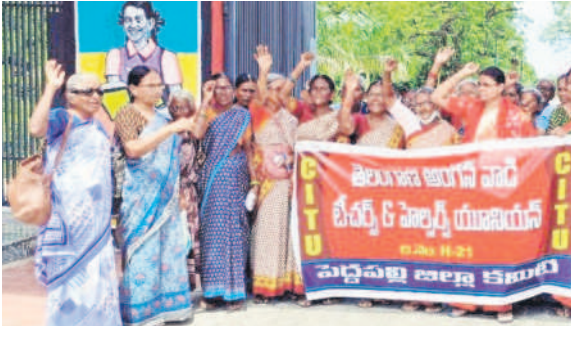
పెద్దపల్లి కలెక్టరేట్ ఎదుట ధర్నా చేస్తున్న అంగన్వాడీ బీబియర్లు, హెల్పర్లు