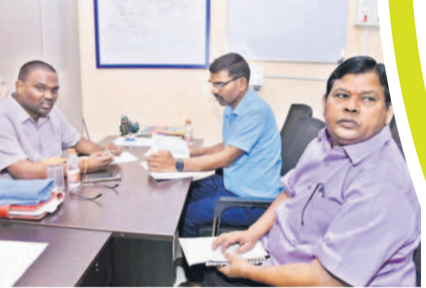
అధికారులతో మాట్లాడుతున్న కలెక్టర్ రాజీవ్ గాంధీ హస్తంతు

ఆర్కూర్ టౌన్, జూలై 4: ధరణి దరఖాస్తుల పరిష్కారంలో అలసత్వానికి తావు లేకుండా యుద్ధప్రాతిపదికన పరిశీలన ప్రక్రియను పూర్తి చేయాలని కలెక్టర్ రాజీవ్ గాంధీ హస్తంతు అధికారులను ఆదేశించారు. ఆర్కూర్ తహసీల్ కార్యాలయాన్ని గురువారం సందర్శించిన కలెక్టర్, ధరణి దరఖాస్తుల పరిశీలన, వాటి పరిష్కారం తీరుపై స్థానిక రెవెన్యూ అధికారులతో సమీక్షించారు. ఆర్కూర్ మండల పరిషత్ ఆయా మాడ్యూల్స్ లో పెండింగ్లో ఉన్న ధరణి దరఖాస్తుల వివరాలు తెలుసుకున్నారు. ఎక్కువ సంఖ్యలో ధరణి దరఖాస్తులు పెండింగ్లో ఉండడంపై కలెక్టర్ ఆసంతోషితుడై ప్రశ్నలు వేశారు. ధరణి దరఖాస్తులపై ప్రత్యేక డ్యూటీని కేంద్రీకరించాలని నెల రోజులుగా సూచిస్తున్నప్పటికీ ఎందుకు శ్రద్ధ చూపడం లేదని అధికారులను ప్రశ్నించారు. స్పెషల్ డైవీ చేపట్టి పెండింగ్ దరఖాస్తులన్నింటినీ క్లీయర్ చేయాలని ఆదేశించారు. తప్పిదాలకు ఆస్కారం లేకుండా వాస్తవ పరిస్థితులతో కూడిన నివేదికను నిబంధనలకు అనుగుణంగా రూపొందించి ఆర్డీవో లాగిన్ కు పార్శ్వ ద్వారా చేయాలన్నారు. ధరణి దరఖాస్తుల పరిష్కారానికి సంబంధించిన ప్రగతిపై రోజువారీగా నితరంగా పరిశీలించాలని ఆర్డీవో కు సూచించారు. కలెక్టర్ వెంట ఆర్కూర్ ఆర్డీవో రాజాగౌడ్, సంబంధిత అధికారులున్నారు.