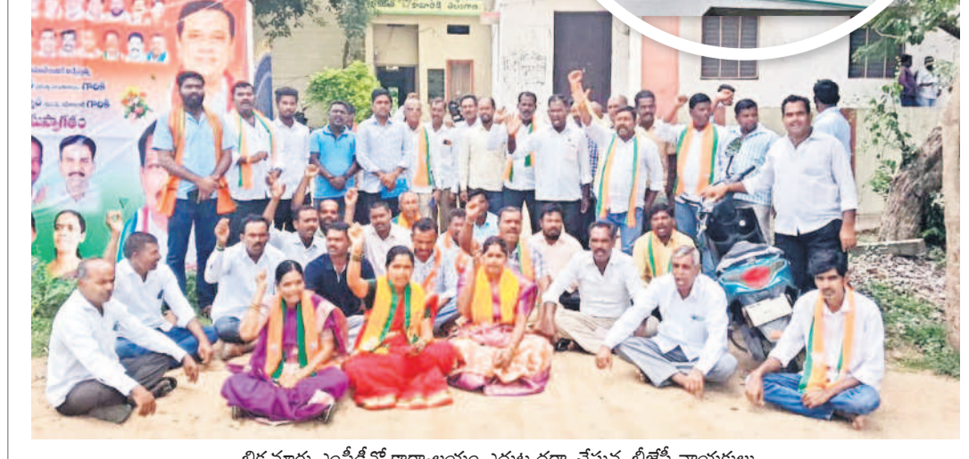
భీకనూరు ఎంపీటీసీ కార్యాలయం ఎదుట ధర్నా చేస్తున్న బీజేపీ నాయకులు

భీకనూరు, జూలై 4: భీకనూరు మండల పరిషత్ కార్యాలయంలో కాంగ్రెస్ నేతల ఫోటోలు పెట్టడంపై బీజేపీ నాయకులు ఆగ్రహం వ్యక్తం చేశారు. ప్రభుత్వ కార్యాలయంలో కాంగ్రెస్ నేతల ఫోటోలు పెట్టడం ఎంపీటీసీ, ఎంపీటీసీలకు వర్తించదు. కోవాలని డిమాండ్ చేస్తూ గురువారం ఎంపీటీసీ కార్యాలయం ఎదుట వారు ధర్నా చేపట్టారు. ఈ సందర్భంగా బీజేపీ నాయకులు మాట్లాడుతూ ఎంపీటీసీ కార్యాలయంలోని ఎంపీటీ గదిలో కాంగ్రెస్ నేతల సోనియా గాంధీ, మల్లికార్జున ఖర్గే, రాహుల్ గాంధీ, షట్నీర్ అలీల ఫోటోలు పెట్టడం ఏమీటని ప్రశ్నించారు. ఇదేమైనా కాంగ్రెస్ పార్టీ కార్యాలయమా అంటూ విమర్శించారు. కారకలైన ఎంపీటీసీ కేసు నమోదు చేయాలని, ఎంపీటీసీపై శాశాసనసభ చర్యలు తీసుకోవాలని కలెక్టరేట్, ఎమ్మెల్యే క్యాంపు కార్యాలయంలో వినవ్రత అందించినట్లు తెలిపారు.