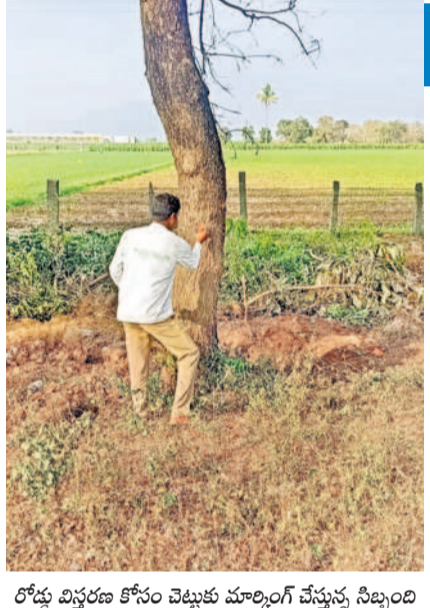
రోడ్డు విస్తరణ కోసం చెట్టుకు మార్కెట్ వేస్తున్న సిబ్బంది

విస్తరణకు నోచుకోక బయ్యారం మండలం కొత్తపేట వద్ద గుంతలమయంగా ఉన్న ఎన్ హెచ్ 930వీ రహదారి