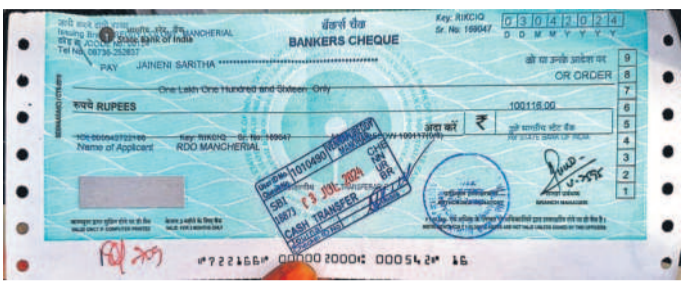
కోటపల్లి తహసీల్దార్ కార్యాలయంలో అధికారులు అందజేసిన చెల్లని చెక్కు