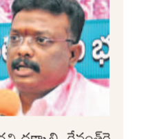
సీఎం రేపంట్లో డిడి కృతజ్ఞతను తెలిపిన ఎమ్మెల్యే

చేస్తుంటే, సహకరించాలని మీకు మనసు ఎలా వచ్చింది? నాలాంటి వెనుకబడ్డ వారికి రాజీతులు అవకాశాలు రావు. వచ్చినా డబ్బులు సంపాదించే ముమ్మల్ని డిమాండ్ చేశారు. నేను కేసీఆర్ ఇచ్చిన అవకాశాన్ని పడులుకోవాలని కోలేదు. నా న్యాయ పోరాటానికి మద్దతు ఇవ్వండి. ఎమ్మెల్యేగా నేను నియామకం పొందే వరకు తొడబాటును అందించాలి అని కోరుకుంటున్నా. ఉద్యమం వల్లనే అయిన రేపంట్లో.. లీగర్ లిటిగేషన్లో తమను ఇరికించి పరోక్షంగా అవమానిస్తున్న విషయం బోధపడటం లేదు? అని ప్రశ్నించారు. 'మీకు కచ్చితంగా పదవి దక్కాలి. రేపంట్లో డిడి కృతజ్ఞత ఉంటే.. రాజ్యసభకు పంపించి ఉండొచ్చు. ఎమ్మెల్యేగా కోటాలో ఎమ్మెల్యేగా నియమించి ఉండొచ్చు. మంత్రిగా ప్రమాణ స్వీకారం చేయించి, ఆర్డీలపై ఎమ్మెల్యేగా నియమించి ఉండొచ్చు. పురుగుల మందు కాలు వచ్చే వరకు మంత్రిగా కొనసాగించి ఉండొచ్చు' కదా! అని పేర్కొన్నారు.