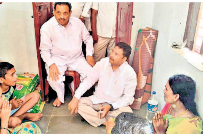
సీఎం రేపంట్లో డిడి కృతజ్ఞతను తెలిపిన ఎమ్మెల్యే