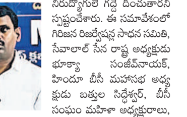
సీఎం రేపంట్లో డిడి కృతజ్ఞతను తెలిపిన ఎమ్మెల్యే