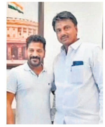
సీఎం రేపంట్లో డిడి కృతజ్ఞతను తెలిపిన ఎమ్మెల్యే