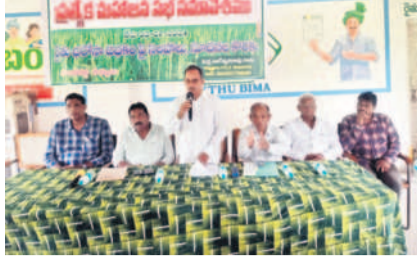
మణుగూరు టౌన్: అభిప్రాయాల తెలుపుతున్న రైతులు

దమ్మపేట, జూలై 3: రైతు భరోసా పథకంపై దమ్మపేట సహకార సంఘం అధ్యక్షులు బుద్ధవారం రైతుల అభిప్రాయాల సేకరణ కార్యక్రమం జరిగింది. సాగులో ఉన్న ప్రతి ఎకరాకు, ఎలాంటి పరిమితులు లేకుండా రైతు భరోసా