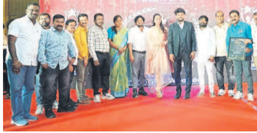
'అంజనీపుత్ర'కు బెస్ట్ రియల్ ఎస్టేట్ అవార్డును లండుకుంటున్న అంజనీపుత్ర చైర్మన్. డైరెక్టర్లు