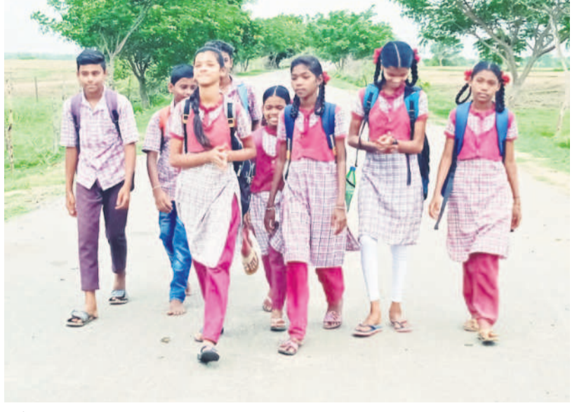
కోటపల్లి మండలం ఎదులబండ్లం నుంచి సిర్పా ప్రభుత్వ ఉన్నత పాఠశాలకు నడుచుకుంటూ వెళ్తున్న విద్యార్థులు