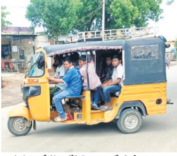
బస్సు సౌకర్యం లేకపోవడంతో కెరమెల మండలంలోని కొండబాగుడ గ్రామం నుంచి ఆటోలో వెళ్తున్న విద్యార్థులు