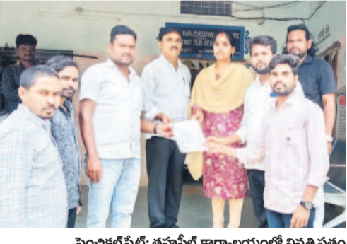
పెంచుకల్ పేట్: తహసీల్ కార్యాలయంలో వినతి పత్రం పెంచుకల్ పేట్లో.. అందజేస్తున్న బీజేపీ నాయకులు