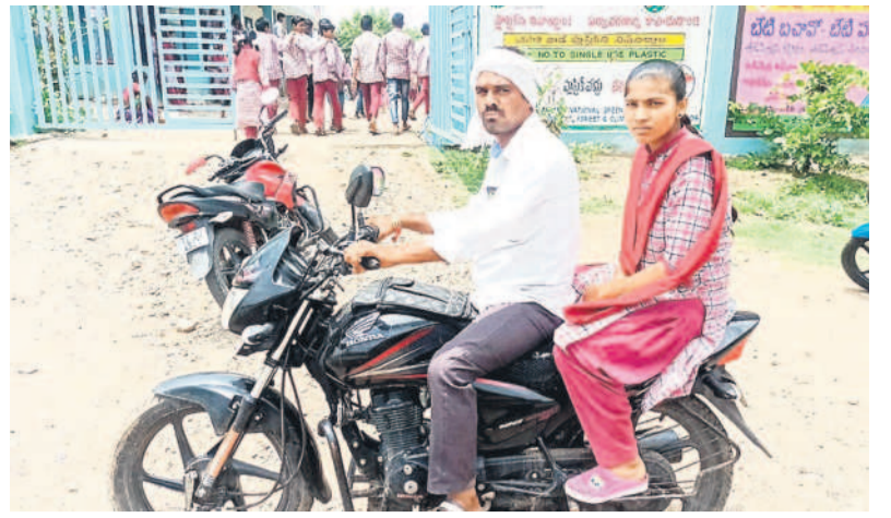
కెరమెల మండలంలోని కేలికే(తీ) గ్రామం నుంచి బైక్పై విద్యార్థిని బడికి తీసుకువచ్చిన తండ్రి