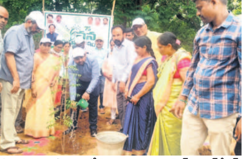
కోటపల్లి ప్రభుత్వ ఉన్నత పాఠశాలలో మొక్క నాటుతున్న కలెక్టర్ కుమార్ దీపక్

కోటపల్లి, జూలై 2 : చెట్లతోనే మానవాళికి మనుగడ అని, ప్రతి ఒక్కరూ మొక్కలు నాటి సంరక్షించాలని మంచెర్యాల కలెక్టర్ కుమార్ దీపక్ పిలుపునిచ్చారు. కోటపల్లి మండలంలోని ప్రభుత్వ ఉన్నత పాఠశాలలో మంగళవారం వన మహోత్సవం కార్యక్రమంలో భాగంగా మొక్కలు నాటారు. ఈ సందర్భంగా కలెక్టర్ మాట్లాడుతూ పాఠశాలలో విద్యార్థులు ఒక్కొక్క మొక్క నాటి అది పరిగె వరకూ బాధ్యత తీసుకోవాలన్నారు. చెట్లతోనే పర్యావరణం రక్షణ సాధ్యమని వివరించారు. ఇంటింటికీ ఆరు మొక్కల చొప్పున అందజేసి వాటిని నాటిలా చూడాలని అధికారులకు సూచించారు. అనంతరం విద్యార్థులతో కలిసి మొక్కల వద్ద ఫోటోలు దిగారు. కోటపల్లి ఎస్సీ హాస్టల్లో అదనపు గదుల నిర్మాణంతో పాటు మరుగుదొడ్లను నిర్మించాలని ఎంపీపీ మంత్రి సురేఖ కలెక్టర్ కు వినతిపత్రం ఇచ్చారు. ఈ కార్యక్రమంలో