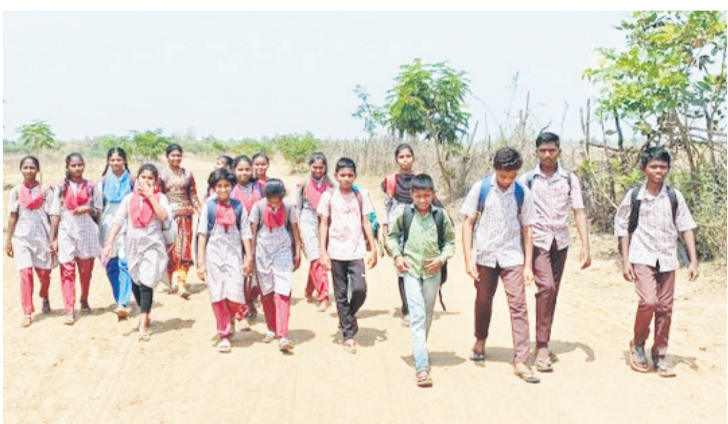
కోటపల్లి మండలం రాజారం, కావర కొత్తపల్లి గ్రామాల నుంచి దేవులవాడ ప్రభుత్వ ఉన్నత పాఠశాలకు కాలినడకన వెళ్తున్న విద్యార్థులు