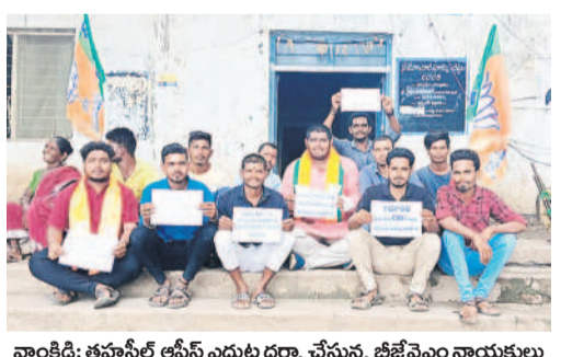
వారికి: తహసీల్ ఆఫీస్ ఎదుట ధర్మా చేస్తున్న బీజేపీ నాయకులు

● నిరుద్యోగుల సమస్యలు పరిష్కరించాలి ● కాంగ్రెస్ సర్కారుకు బీజేపీ డిమాండ్ ● తహసీల్ కార్యాలయాల ఎదుట ధర్మా