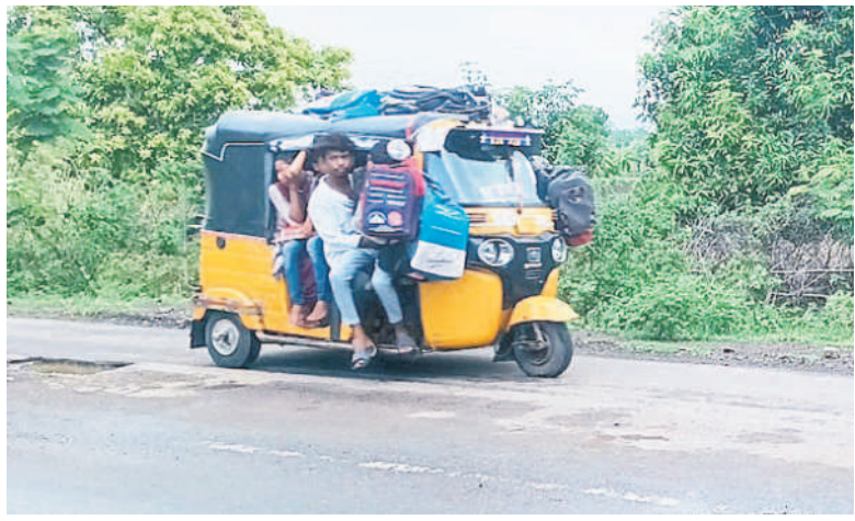
కెరమెల మండలంలోని కొండబాగుడ గ్రామానికి బస్సు సౌకర్యం లేకపోవడంతో ఆటోలో వెళ్తున్న విద్యార్థులు