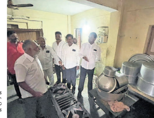
హాస్టల్లో పంటలను పరిశీలిస్తున్న ఎమ్మెల్యే కాలేరు వెంకటేశ్

ఈ విద్యాసంవత్సరం కూడా ఒక్కరూ చేరని వైనం ఆకస్మిక తనిఖీలో విస్తృతమైన ఎమ్మెల్యే కాలేరు వెంకటేశ్ అధికారుల తీరుపై అసహనం.. గోల్కూడ, జూలై 2 : అంబరపేట నియోజకవర్గంలో వసతి గృహంలో కనీస సౌకర్యాలు కరువయ్యాయి. వసుతుల కల్పన కోసం అటు ప్రభుత్వం, నిర్వహణపై ఇటు అధికారుల బట్టించుకోకపోవడంతో విద్యార్థుల సంఖ్య డిడిపోతోంది. ఫలితంగా ఈ విద్యాసంవత్సరం ఒక్కరూ కూడా హాస్టల్లో అడ్మిషన్ తీసుకుని ఉన్నతి స్థానం ఎమ్మెల్యే కాలేరు వెంకటేశ్ ఆకస్మిక తనిఖీలో వెలుగులోకి వచ్చింది. వివరాలు ఇలా ఉన్నాయి. ఇటీవల ప్రజావాణిలో విద్యార్థుల బాగాం మంగళవారం ఎమ్మెల్యే కాలేరు వెంకటేశ్ గోల్కూడ డివిజన్ వీధు గుట్టలోని ప్రభుత్వ బాలర హాస్టల్ ను ఆకస్మికంగా తనిఖీ చేశారు. 2016 లో 55000 గజల ప్రభుత్వ భూమిలో నిర్మించిన భవనం దుస్థితి మాని విస్తృతమయింది. తలుపులు లేని వరుస డొడ్డు, శిథిలాస్థులు చేరిన గదులు, పూర్తిగా అపరిశ్రమైన వాతావరణాన్ని చూసి అధికారుల తీరుపై అసహనం వ్యక్తం చేశారు. ఇక అక్కడ విద్యార్థులు కనీసంపాత