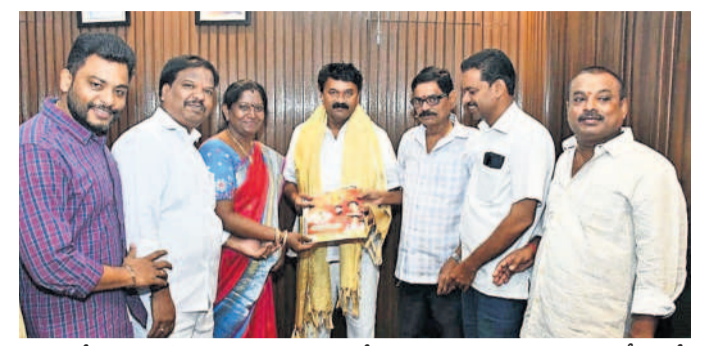
ఎమ్మెల్యే తలసాని శ్రీనివాసయ్యాదమ్, అంధజ్యేష్ఠుల కౌతుకులను సన్మానించారు, విశ్రాంతిలో మాజీ కార్మికులకు ఎన్.కే.పేటకు పాత్రులు తిరిగివచ్చారు

సంప్రదాయాన్ని కొనసాగిస్తున్న బల్లంపేట వాసులు ఎమ్మెల్యే తలసాని శ్రీనివాసయ్యాదమ్