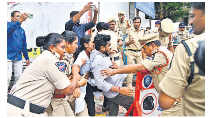
నీటి పేవర్ లీకేజీకి బాధ్యత వహించి ప్రధాని పదవకి మోదీ రాజీనామా చేయాలని డిమాండ్ చేస్తూ మంగళవారం రాజ్ భవన్ ను ముట్టడించిన బీఆర్ఎస్ లోని నాయకులను అరెస్ట్ చేస్తున్న పోలీసులు

టీజీపీఎస్సీ ద్వారా నియామకాలు హైదరాబాద్, జూలై 2 (నమస్తే తెలంగాణ): తెలంగాణ రాష్ట్ర రోడ్డు రవాణా సంస్థ (టీజీపీఎస్సీ)లో ఖాళీగా ఉన్న 3035 పోస్టులను భర్తీ చేసేందుకు ప్రభుత్వం ఆనుమతి ఇచ్చింది. ఆర్టీసీ ఉన్నతాధికారులు ప్రతిపాదనలు పంపిన అన్ని పోస్టుల భర్తీ గ్రీన్ సిగ్నల్ ఇచ్చింది. 2000 డ్రైవర్, 743 క్రామిట్, 114 డిప్యూటీ సూపర్వైజర్లు, 84 మిస్ట్రీ >10వ పేజీలో