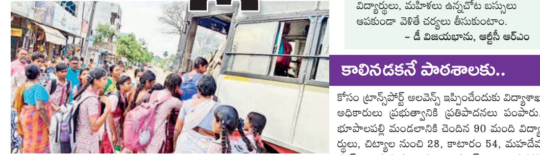
టేకుమట్లలో బస్సు వద్ద క్యూ కడుతున్న విద్యార్థులు

జయశంకర్ భూపాలపల్లి, జూలై 2 (నమస్తే తెలంగాణ) : భూపాలపల్లి జిల్లాలో 69 జిడ్చిపాలెం, 6 మోడల్ మ్యూల్స్, 319 ప్రాథమిక పాఠశాలలు, 44 యూనివర్సిటీ ఉండగా మొత్తం 20,800 మంది విద్యార్థులు విద్యనభ్యసిస్తున్నారు. జిల్లాలోని ఆయా గ్రామాలు, మండల కేంద్రాల్లోని పాఠశాలలకు వెళ్లే విద్యార్థులు అనేక మంది ఆర్టీసీ బస్సు సౌకర్యం లేక ఇబ్బంది పడుతున్నారు. ఎక్కువ మంది కాలినడకనే వెళ్తుండగా, పలువురు సైకిళ్లపై చేరుకుంటున్నారు. టేకుమట్ల మండలంలోని సుబ్బాకపల్లి విద్యార్థులు ఏకంగా ఏడు కిలోమీటర్లు నడిపి వెళ్తున్నారు. రవాణా సౌకర్యం లేకపోవడంతో ప్రభుత్వ పాఠశాలలో దులు పట్టాలను వాటిలో చేర్చిందేమీ మొగ్గుచూపుతున్నారు. కొంతమంది వసతి గృహాల్లో ఉంటూ విద్యనభ్యసించడం, మరికొంత మంది ప్రైవేట్ హాస్టళ్లకు వెళ్తున్నారు. పరిమెల మండలంలో ప్రభుత్వ పాఠశాలలు లేకపోవడం, రవాణా సౌకర్యం కరువై విద్యార్థులు మహాదేవపూర్ సాంఘిక సంక్షేమ వసతి గృహాల్లో ఉంటూ చదువుకుంటున్నారు. కాగా, జిల్లాలో రవాణా సౌకర్యం లేని విద్యార్థుల