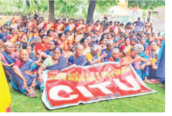
ములుగులోని మంత్రి సీతక్క క్యాంపు కార్యాలయం ఆవరణలో డిమాండ్ చేస్తున్న అంగన్వాడీ టీచర్లు, ఆయాలు