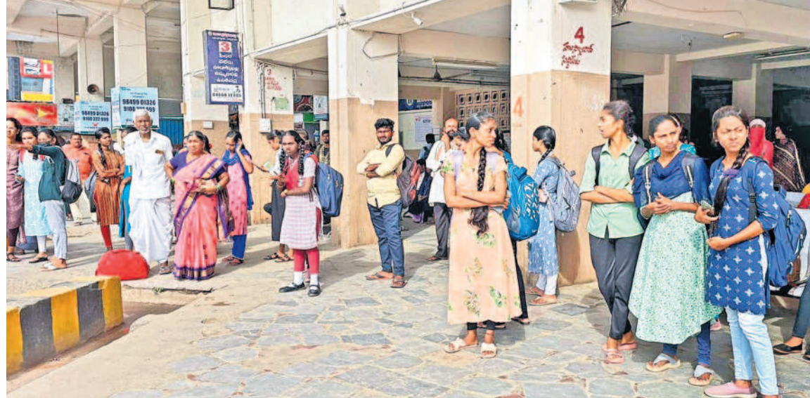
హనుమకొండ బస్ స్టేషన్లో బస్సుల్లోకి ఇబ్బందులు పడుతున్న విద్యార్థులు

సర్కారు పాఠశాలపై ప్రభుత్వం లలసత్వం ప్రదర్శిస్తోంది. మౌలిక వసతుల కల్పన దేవుడయ్యారు.. విద్యార్థులకు ప్రధానమైన రవాణా సౌకర్యం కల్పించడంలో హిరంగా విఫలమవుతున్నది. చదువుకునేందుకు గ్రామాలు, మండల కేంద్రాలు, పట్టణాలకు వెళ్లడానికి తగినన్ని బస్సులు లేక స్కూలెట్లో పడరాని పాట్లు పడుతున్నారు. కాలినడకన, సైకిళ్లపై కిలోమీటర్ల దూరం వెళ్ల వస్తున్నారు. కొంతమంది ప్రైవేట్ వాహనాలను ఆశ్రయిస్తున్నారు. ప్రమాదమని తెలిసినా ఆటోలో కిక్కిరిస్తూ ప్రయాణిస్తున్నారు. కూర్చోవడానికి స్థలం లేక ఆటోలో వెనుక నిలబడి వెళ్తున్నారు. ప్రధాన రహదారిపై ఉన్న గ్రామాలకు తప్ప మిగతా మారుమూల ప్రాంతాలకు పాఠశాలలు ప్రారంభమై నప్పటినుంచి బస్సులు నడవడం లేదని ఆరోపిస్తున్నారు. ఆయా రూట్లలో కూడా సమయానికి బస్సులు రాక.. వచ్చినా విద్యార్థులు, మహిళలను చూసి ఆపకుండా వెళ్తున్నారని ఆగ్రహం వ్యక్తం చేస్తున్నారు. రవాణా సౌకర్యం లేక.. తమ పిల్లల బాధలు చూడలేక తల్లిదండ్రులు దూరమైనా వసతి గృహాల్లో ఉంచి చదివిపంపింపిస్తున్నారు. మరొకరందరు ఆర్థిక భారమైనా ప్రైవేట్ హాస్టళ్లలో ఉంచుతున్నారు. ఇదే సమయంలో పల్లెలకు వస్తున్న ప్రైవేట్ పాఠశాల బస్సులను చూసి పలువురు తల్లిదండ్రులు ఆకర్షితులవుతున్నారు. ఫలితంగా ప్రభుత్వ పాఠశాలల్లో విద్యార్థుల సంఖ్య తగ్గిపోతున్నదనే వాదన వినిపిస్తున్నారు. కాగా, రద్దీ రూట్లలో అదనపు ట్రిప్లు తీసుకున్నామని అర్జీని అధికారులు తప్పించుకుంటున్నారని చెబుతున్నారు. ఉమ్మడి వరంగల్ జిల్లాలో బస్సులు లేక బడికిపోయే విద్యార్థులు ఎదుర్కొంటున్న కష్టాలపై 'నమస్తే తెలంగాణ' అందిస్తున్న ప్రత్యేక కథనం..