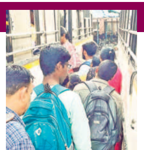
హనుమకొండ బస్ స్టేషన్లో బస్సుల్లోకి ఇబ్బందులు పడుతున్న విద్యార్థులు

హనుమకొండ చౌరస్తా, జూలై 2 : బస్సుల కొరత, సమయానికి సరిపడా రాక హనుమకొండ జిల్లాలోని పలు గ్రామాల నుంచి పట్టణాలకు వస్తున్న విద్యార్థులు ఇబ్బందులు పడుతున్నారు. పడోతరగతి, ఇంటర్, డిగ్రీ చదివే పేద విద్యార్థులకు ఆర్టీసీ బస్సు తప్ప మరో మార్గం లేదు. సొంత వాహనాలు లేక, అధిక ఛార్జీలు చెల్లించి పాఠశాలలు, కాలేజీలకు వెళ్లేకొందరు ఇంటికి పరిమితమవుతున్నారు. పానులూరు బస్సులు లేకపోవడం, పానులకు పరిమితమవుతున్న విధిచరణతో ఆందోళన చెందుతున్నారు. దీనికి తోడు విద్యార్థులు, మహిళలకు ఉన్న స్టేజిల వద్ద డ్రైవర్లు బస్సులు ఆపకుండా వేగంగా వెళ్తున్నారు. ఉదయం, సాయంత్రం వేళల్లో పాఠశాల, కాలేజీ విద్యార్థులు అనేక పాట్లు పడుతున్నారు. విద్యార్థుల సంఖ్యకు అనుగుణంగా ఆర్టీసీ బస్సులు నడపడంలేదు. వచ్చిన ఆరకొర బస్సుల్లో కిక్కిరిసిన ప్రయాణంతో ఊపివాడకుండా ప్రయాణం చేస్తున్నారని వారు వాపోతున్నారు. కనీసం నిలబడేందుకు కూడా అవకాశం ఉండటంలేదని అంటున్నారు. బస్సులో 100కు పైగా విద్యార్థులు ఉంటున్నారని, ప్రమాదమని తెలిసినా ఆటోలో వెనుక నిలబడి వెళ్తున్నారని చెబుతున్నారు. ఉమ్మడి వరంగల్ జిల్లాలో బస్సులు లేక బడికిపోయే విద్యార్థులు ఎదుర్కొంటున్న కష్టాలపై 'నమస్తే తెలంగాణ' అందిస్తున్న ప్రత్యేక కథనం..