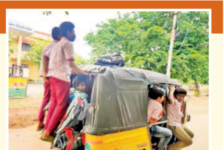
నర్సారాజుపేటలో ప్రమాదకరంగా ప్రయాణిస్తున్న విద్యార్థులు

మహబూబాబాద్, జూలై 2 (నమస్తే తెలంగాణ) : మహబూబాబాద్ జిల్లా పరిధిలోని 18 మండలాల్లో మొత్తం 693 గ్రామాలున్నాయి. ఇందులో కేవలం 241 గ్రామాలకు మాత్రమే బస్సు సౌకర్యం ఉండగా, మిగిలిన 392 గ్రామాలకు బస్సు రాక విద్యార్థులు నానా ఇబ్బందులు పడుతున్నారు. దీంతో కాలినడకన, సైకిళ్లపై వెళ్లే ఆటోల్లో విద్యార్థులు పాఠశాలలు, కళాశాలలు చేరుకుంటున్నారు. విద్యార్థుల అవసరాలను దృష్టిలో పెట్టుకొని బస్సులు నడపాలని విద్యార్థుల తల్లిదండ్రులు వేడుకుంటున్నారు. బస్సు సౌకర్యం లేక ఆయా గ్రామాలు, మండల కేంద్రాల్లోని తెలంగాణ మోడల్ స్కూల్, జడ్చి ఉన్నత పాఠశాలలో చదివే విద్యార్థులు ప్రమాదమని తెలిసినా ఆటోల్లో కిక్కిరిస్తూ ప్రయాణిస్తున్నారు. అంతేకాకుండా దూరాన్ని బట్టి నెలకు రూ. 700 నుంచి రూ. 1000 వరకు తప్పని ఆర్థిక భారం పడుతున్నదని తల్లిదండ్రులు ఆవేదన వ్యక్తం చేస్తున్నారు. బాలికలకు ఉచిత ప్రయాణ సౌకర్యం ఉన్నా పల్లెలకు బస్సులు రాక ప్రైవేట్ వాహనాల్లోనే వెళ్తున్నట్లు కాగా, జిల్లాలోని టోటల్ రూ. మహబూబాబాద్ బస్ డిపార్టుమెంట్, వీటి పరిధిలో మొత్తం 159 బస్సులు