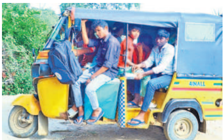
ములుగు మండలం వద్దపల్లి గ్రామం నుంచి ఆటోలో పాఠశాలకు వెళ్తున్న విద్యార్థులు