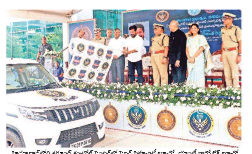
హైదరాబాద్ లోని కమాండ్ కంట్రోల్ సెంటర్ లో సైబర్ సెక్యూరిటీ బ్యూరో, యాంటీ నార్కోటిక్ బ్యూరో కొనుగోలు చేసిన 155 వాహనాల శ్రేణిని మంగళవారం జెండా డివి ప్రారంభిస్తున్న సీఎం రేవంత్ రెడ్డి

ఛత్తీస్ గఢ్ లో ఎన్కౌంటర్ 11 మంది నక్కల్స్ మృతి >7 అదానీ కోర్టు మాలీ పై దర్యాప్తు! విజిలెన్స్ విచారణకు తమిళనాడు అనుమతి బొగ్గు డిగుమతుల్లో 3 వేల కోట్ల అక్రమాలు!