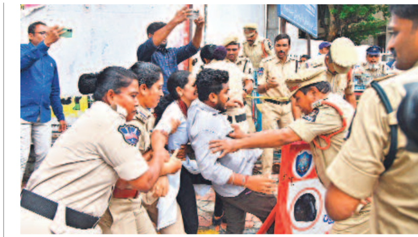
నీట్ పేపర్ లీకేజీకి బాధ్యత వహించి ప్రధాని పదవకి మోడీ రాజీనామా చేయాలని డిమాండ్ చేస్తూ మంగళవారం రాజకీయవేదిక ముట్టడించిన బీఆర్ఎస్ నాయకులను అరెస్ట్ చేస్తున్న పోలీసులు

టీజీపీఎస్సీ ద్వారా నియామకాలు హైదరాబాద్, జూలై 2 (నమస్తే తెలంగాణ): తెలంగాణ రాష్ట్ర రోడ్డు రవాణా సంస్థ (టీజీపీఎస్)లో ఖాళీగా ఉన్న 3035 పోస్టులను భర్తీ చేసేందుకు ప్రభుత్వం ఆనుమతి ఇచ్చింది. ఆర్టీసీ ఉన్నతాధికారులు ప్రతిపాదనలు పంపిన అన్ని పోస్టుల భర్తీ గ్రీన్ సిగ్నల్ ఇచ్చింది. 2000 డ్రైవర్, 743 క్రామిట్, 114 డిప్యూటీ సూపర్వైజర్లు, 84 డిప్యూటీ డ్రైవర్లు, 84 డిప్యూటీ >12వ పేజీలో