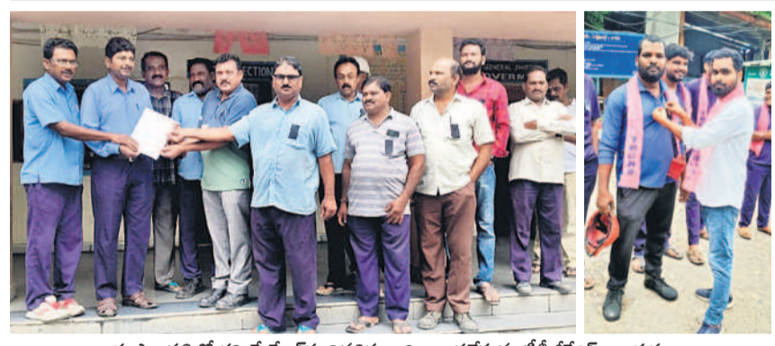
భూపాలపల్లిలో గౌరవ మేనేజర్ కు వినపిత్రాన్ని అందజేస్తున్న టీబీజీకేఎస్ నాయకులు

హనుమకొండ చౌరస్తా, జూలై 1: నిరుద్యోగుల రోడ్డు క్యాన్సర్. దీవెన్ వాయిదా వేయాలని డిమాండ్ చేశారు. ఈమేరకు సోమవారం హనుమకొండలోని జిల్లా కేంద్ర గ్రంథాలయం ఎదుట అభ్యర్థులు బైటాయింది ఆందోళన నిర్వహించారు. ఈ సందర్భంగా ప్రభుత్వానికి వ్యతిరేకంగా నివాదాలు చేశారు. దీవెన్ పోస్టులు 25వేలకు పెంచాలని డిమాండ్ హనుమకొండలో గ్రంథాలయం వద్ద బైటాయింది దీవెన్ అభ్యర్థులు