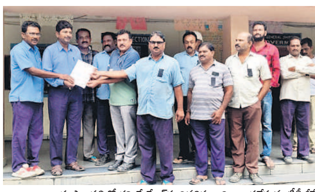
భూపాలపల్లిలో గౌరవ మేనేజర్ కు విసవకావాలని అందజేస్తున్న టీటీజీకేఎస్ నాయకులు

హనుమకొండ చౌరస్తా, జూలై 1 : నిరుద్యోగులు రోడ్లెక్కి నిరసన తెలుపుతున్నారు. డిమాండ్ చేయాలని డిమాండ్ చేశారు. ఈ సందర్భంగా ప్రభుత్వానికి వ్యతిరేకంగా నిరసన తెలుపుతున్న అభ్యర్థులు