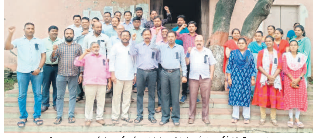
జీఎం కార్యాలయంలో నల్లబ్యాడ్లలో నిరసన వ్యక్తం చేస్తున్న ఉద్యోగులు, టీబీజేకేఎస్ నాయకులు

నల్లనేల భగ్గుమన్నది. సిరుల సింగరేణి బొగ్గు బ్యాంకుల వేలం, ప్రైవేటీకరణకు వ్యతిరేకంగా కార్మికుల కోరిక కదం తొక్కింది. కేంద్ర, రాష్ట్ర ప్రభుత్వాల కుట్రపై పోరుబాట పట్టింది. టీబీజేకేఎస్ ఇచ్చిన పిలుపుమేరకు సోమవారం గానులు, ఓసీపిలు, డిపార్ట్ మెంట్లపై కార్మికులు నల్ల బ్యాడ్లను ధరించి నిరసనలు తెలిపారు. అధికారులకు వినతి పత్రాలు అందించారు. బొగ్గు బావులను సింగరేణి సంస్థకే అప్పగించాలని, లేదంటే ఉద్యమం తీవ్రతరం చేస్తామని హెచ్చరించారు.