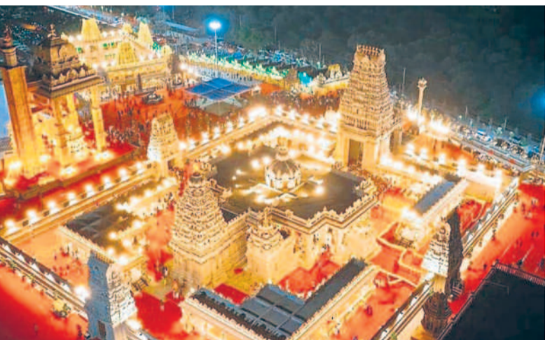
అత్యద్భుతంగా దర్శనమిస్తున్న స్వర్గగిరి వేంకటేశ్వరాలయం

అధ్యుత శిల్పకళ.. శైత్రంలో ఉన్న స్తంభాలు వేటికంటే ప్రత్యేకమైనవి. గుడిలో సిమెంట్ను ఉపయోగించలేదు. రాతి కట్టడాలు, ఇంటలైటింగ్ పద్ధతుల్లో నిర్మించారు. డ్రావిడ్ శైలిలో నిర్మించిన ఆలయంలో పల్లవ, విజయనగర, చోళ, చాళుక్యుల నాటి కళా నైపుణ్యం కనిపిస్తుంది. ఒక్కో స్తంభం ఒక్కో రూపంలో ఉంటుంది. అలయం బయట 120 అడుగుల హనుమాన్ ఏకశిలా విగ్రహాన్ని నెలకొల్పారు. ఈ విగ్రహాన్ని చెక్కడానికి ఐదేండ్ల సమయం పట్టింది. 1,500 కేజీల బరువున్న జయ గంటను ఇక్కడ చూడవచ్చు. ఒక్క సారి మోగిస్తే మూడు నిమిషాల పాటు దాని తరంగాలు ప్రతిధ్వనిస్తాయి. ప్రపంచంలో ఏక్కడా లేని మదన గోపాలాడి విగ్రహాన్ని చూడవచ్చు. పది చేతులతో ఉన్న విగ్రహాన్ని దర్శించుకోవచ్చు. అలయంలో మరో