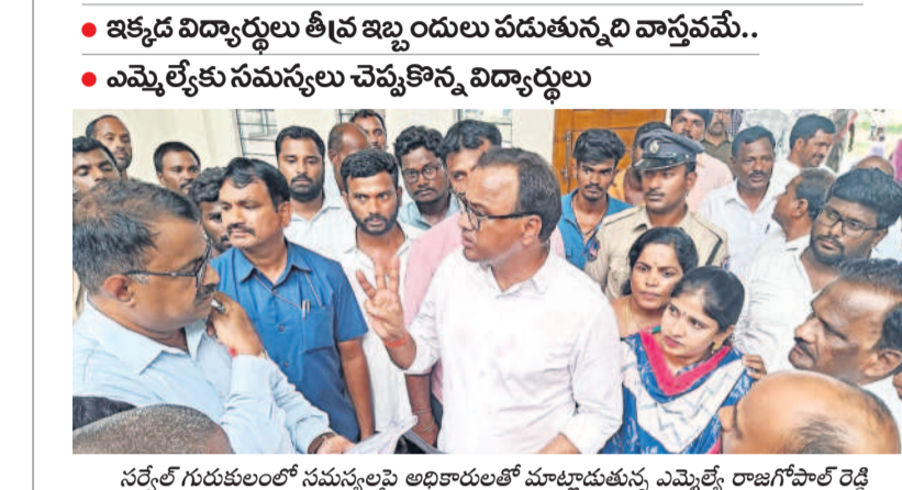
సర్వేల్ గురుకులంలో సమస్యలపై అధికారులతో మాట్లాడుతున్న ఎమ్మెల్యే రాజగోపాల్ రెడ్డి

సంస్థాని నారాయణపురం, జూన్ 29 : మండలంలోని సర్వేల్ గురుకుల పాఠశాలలో రూ.20 కోట్లతో నిర్మించిన నూతన భవనాలను 15 రోజుల్లో ప్రారంభిస్తుమని, విద్యార్థులు ఆ పాఠశాలలో వసతులనున్నట్లు త్వరలోనే కల్పిస్తామని మునుగోడు ఎమ్మెల్యే కోమటి రెడ్డి రాజగోపాల్ రెడ్డి ఆహ్వానించారు. నమస్తే తెలంగాణ దిన పత్రికతో ఈ నెల 24న ప్రచురితమైన 'సర్వేల్ గురుకులం.. సమస్యలతో సతమతం' కథనానికి ఆయన స్పందించారు. గురుకుల పాఠశాలను శనివారం ఆయన ఆకస్మికంగా తనిఖీ చేశారు. ఈ సందర్భంగా గురుకులంలోని విద్యార్థులు ప్యాంపు తిరుగడం లేదని, వాషింగ్ మెషిన్లు ఉన్నాయని, సెల్ ఫోన్లను మరగించాలని, అన్నింటికీ విద్యార్థులు కోరాలని ఆయన ప్రధానోపాధ్యాయుడిని మండ్లి పంపారు. గురుకులంలో విద్యార్థులు తీవ్ర ఇబ్బందులు పడుతున్న మాటలు విన్నామని, పాఠశాలలో నెలకొన్న సమస్యలపై సోమవారం రివ్యూ నిర్వహిస్తుమని తెలిపారు. ప్రస్తుతం అక్కడవసరంగా కావాల్సిన వసతులను ఏర్పాటు చేస్తుమని చెప్పారు. ఆనంతరం గురుకులంలో నిర్మించిన నూతన భవనాలను పరిశీలించి కంట్రాక్టర్ పలు సూచనలు చేశారు. కాంట్రాక్టర్ రూ.7కోట్ల బిల్లు పెండింగ్ ఉందని తెలుపడంతో బిల్లు ఇప్పించేందుకు కృషి చేస్తామని తెలిపారు. కొత్తగా నిర్మించిన భవనాలు బాగున్నాయని, మరొక డాక్యుమెంట్ నిర్మించడానికి నిధులు కూడా మంజూరు చేయిస్తామని ఎమ్మెల్యే చెప్పారు. అలాగే సర్వేల్ గ్రామంలోని జిల్లా పరిషత్ ఉన్నత పాఠశాలను తనిఖీ చేసి విద్యార్థులు, ఉపాధ్యాయులతో మాట్లాడారు. ఎమ్మెల్యే వెంట ఎంపీపీ గుల్షా ఉమాదేవి, జడ్పీటీసీ వీరవంశీ భానుమతి గౌడ్, ప్రధానోపాధ్యాయుడు వెంకటేశం, నాయకులు గుల్షా శేఖర్ రెడ్డి, ఉప్పుల లింగరావు, వెనుముల శంకర్ రెడ్డి, చిలకరాజు రాజు, సతీశ్, షేక్ షబీర్, ఎల్లంకి చంద్రయ్య పాల్గొన్నారు.