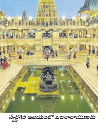
స్వర్గగిరి ఆలయంలో జలనారాయణము

భక్తులకు ఇబ్బందులు లేకుండా సదుపాయాలు. ఉపయోగించిన దాని కంటే పెద్ద సంఖ్యలో భక్తులు తరలివస్తుండటంతో ఆ మేరకు సదుపాయాలు కల్పించేందుకు ఏర్పాటు చేస్తున్నట్లు అలయ ధర్మకర్తలు తెలిపారు. తాగునీరు, లాయితైపు సరిపడా ఏర్పాటు చేశామని, వ్యర్థాలకు వీల్చెప్పే అందుబాటులో ఉంచామని తెలిపారు. రోజూ 8వేల నుంచి 10వేల మందికి నిత్యాన్న దానం చేస్తున్నట్లు తెలిపారు. శాశ్వత వీధి దీపాలు, రోడ్ల నిర్మాణానికి చర్యలు తీసుకుంటున్నట్లు తెలిపారు. దూర ప్రాంతాల నుంచి వచ్చే వారికి ఇబ్బందులు లేకుండా వచ్చే నెలలో కాటేజీలు ప్రారంభించనున్నట్లు ప్రకటించారు. భక్తుల భక్తకోసం పోలీసులతో సమన్వయం చేసుకుంటున్నట్లు చెప్పుకొన్నారు. ఆర్టీసీ హైదరాబాద్, యాదగిరిగట్టు నుంచి రోజూ బస్సులు సదుపాతున్నట్లు తెలిపారు.