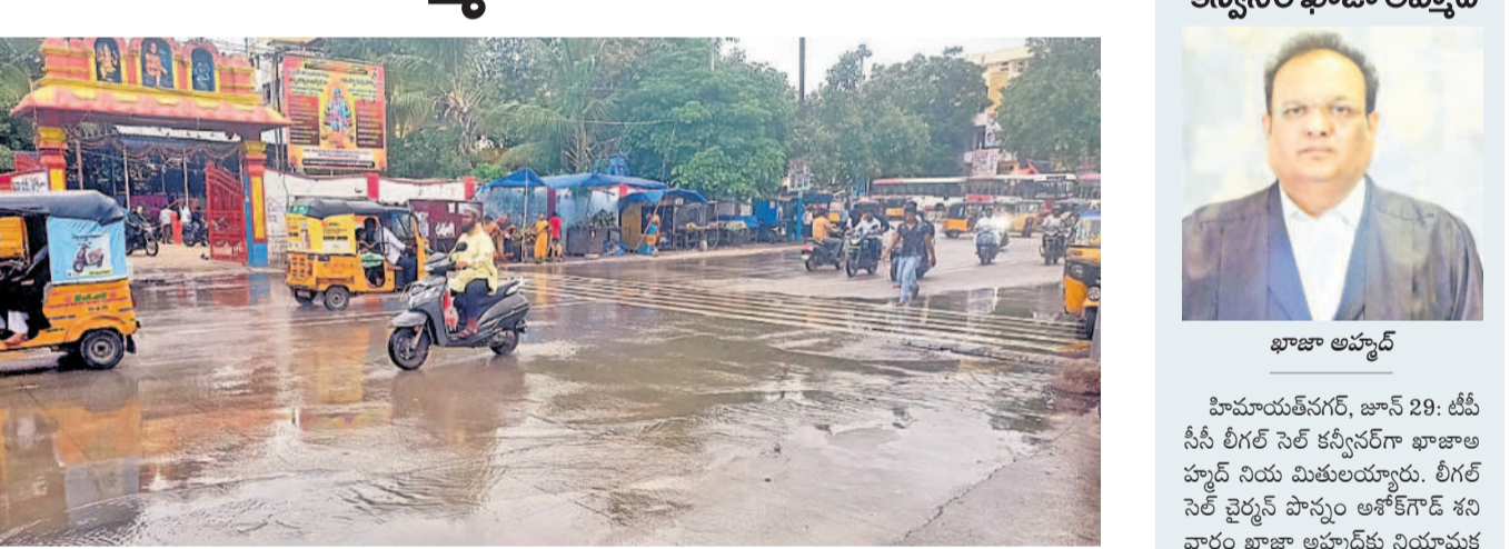
బోరబండ బస్ టెర్మినల్ వద్ద ప్రధాన రహదారిపై మురుగు పరుగు