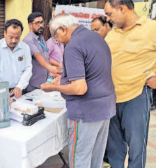
నారాయణగూడలోని మెట్కోట్ పార్కు ఆవరణలో బీటీ చెక్ ఉన్న వైద్యశిబిరం నిర్వహించారు