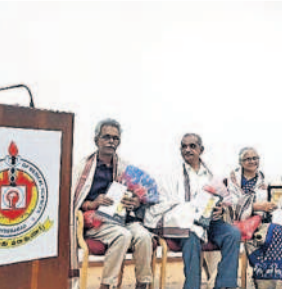
సీఎం రెవంట్ రెడ్డి వైద్య శిబిరంలో పాల్గొంటున్న డాక్టర్లు