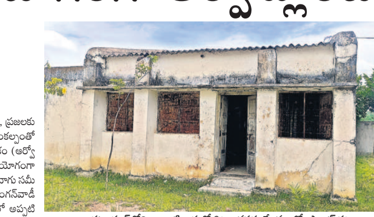
కట్టంగూరులోని అంబటివారులో శిథిలమౌతున్న ఆర్ఎస్ ప్లాంట్ గది

కట్టంగూరు, జూన్ 28: విద్యార్థులు, ప్రజలు శుభ్రమైన తాగునీరు అందించాలనే సంకల్పంతో ఏర్పాటు చేసిన రక్షిత తాగునీటి పథకం (ఆర్ఎస్ ప్లాంట్) నిర్మాణం లోపంతో నిరుపయోగంగా మారింది. కట్టంగూరులో గల అంబటివారు సమీపంలోని ప్రాథమిక పాఠశాల, అంగన్వాడీ కేంద్రం అవరణలో ఓ ప్రత్యేక గదిలో అప్పటి ఎంపీ బూర నర్సయ్యగౌడ్ నిధులు రూ. 4.80 లక్షలతో ఏర్పాటు చేసిన ఏప్రిల్ 2017లో ఆర్ఎస్ ప్లాంట్ ప్రారంభించారు. కానీ ప్లాంట్ నిర్మాణం లోపంతో తో పాటు అధికారులు పట్టణంకోసం వడంతు ఏర్పాటు చేయాలనే పడింది. ముందు మార్పు లేకుండా గ్రామ శివారులో ప్లాంట్ ఏర్పాటు చేయడంతో పర్యవేక్షణ కలుపుంది. దాంతో గర్భ తియ్యని వ్యక్తులు గది తలుపులు పగలకొట్టి అందులో విద్యుత్ మోటర్లు, విలువైన యంత్ర పరికరాలు, విద్యుత్ వైర్లు అవసరం చుకుపోయారు. ఇంత జరుగుతున్న సందర్భాల్లో అధికారులు మాత్రం అటువైపు కన్నెత్తి చూడడం