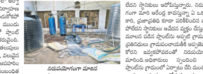
నిరుపయోగంగా మారిన ఆర్ఎస్ ప్లాంట్ యంత్ర పరికరాలు

లేదని స్థానికులు ఆరోపిస్తున్నారు. నిరుపయోగంగా మారి ఆరేళ్ల కావస్తున్న ఏ ఒక్క ఆధికారి, ప్రజాప్రతినిధి కూడా పరిశీలించిన పాపాన పోలేదని స్థానికులు ఆవేదన వ్యక్తం చేస్తున్నారు. ప్రతినిధులు గ్రామపంచాయతీకి గ్రామ ప్రజా కలెక్షనరీస్ అందుకోవడంతో నిరుపయోగంగా మారింది. అధికారులు స్పందించి ఆర్ఎస్ ప్లాంట్ను గ్రామంలో ఏర్పాటు చేసే మంపిటీని అందించాలని ప్రజలు కోరుతున్నారు.