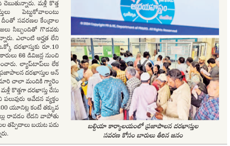
బిల్డింగ్ అధికారులతో ప్రజాపాలన దరఖాస్తుల సవరణ కోసం బాబులు తీరని జనం

సీఎంపి చెబుతున్నారు. మళ్ళీ కొత్త దరఖాస్తులు పెట్టుకోవాలంటున్నారు. దీంతో సవరణల కేంద్రాల వద్ద ప్రజలు సిబ్బందితో గొడవకు దిగుతున్నారు. ఎలాంటి అడ్డం లేని వారికి ఒక్కో దరఖాస్తు రూ.10