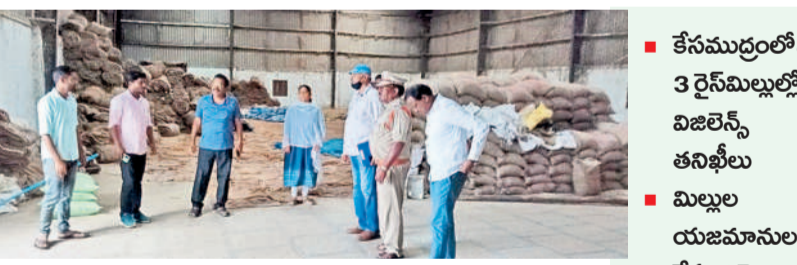
ధాన్యం బస్తాలు లేకుండా ఖాళీగా ఉన్న మణికంఠ రైస్ మిల్లు గోదాము