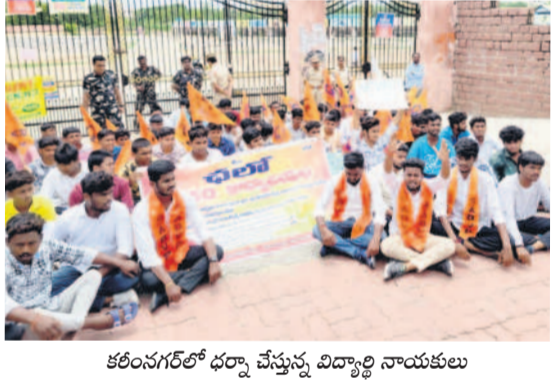
కరీంనగర్లో భర్నా చేస్తున్న విద్యార్థి నాయకులు