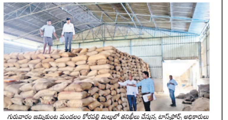
గురువారం జమ్మికుంట మండలం కోర్టులోని మిల్లర్ తనిఖీలు చేస్తున్న ట్యాంక్ ట్యాంక్ అధికారులు

కరీంనగర్, జూన్ 28 (నమస్తే తెలంగాణ ప్రతినిధి) / జమ్మికుంట: హుజూరాబాద్ అసెంబ్లీ నియోజకవర్గం పరిధిలోని పలువురు మిల్లర్లపై విమర్శలు వెల్లువెత్తుతున్నాయి. సీఎంఆర్ ధాన్యం అమ్మకాని సామ్యు చేసుకుంటున్నారని, రాష్ట్ర ట్యాంక్ ట్యాంక్ అధికారుల దాడుల్లో బట్టబయలు అయ్యింది. కేవలం రెండు మిల్లుల్లోనే 4.15 లక్షల క్వీంట్లాళ్ల పైబిలుకు ధాన్యం మాయమైనట్లు గుర్తించి, వాటి విలువ ₹130.95 కోట్లకుపైగా ఉన్నట్లు నిర్ధారించారు. అధికారుల ఫిర్యాదు మేరకు జమ్మికుంట మండలం కోర్టులోని మహాశిల్ప రైస్ మిల్, ఇల్లందకుంట మండలం శ్రీరాములపల్లిలోని సీతారామ్ అగ్రో ఇండస్ట్రీస్ ను అదుపులోకి తెచ్చివ్వడం కోరారు. వాటి విలువ ₹130.95 కోట్లకుపైగా ఉన్నట్లు నిర్ధారించారు. అధికారుల ఫిర్యాదు మేరకు జమ్మికుంట మండలం కోర్టులోని మహాశిల్ప రైస్ మిల్, ఇల్లందకుంట మండలం శ్రీరాములపల్లిలోని సీతారామ్ అగ్రో ఇండస్ట్రీస్ ను అదుపులోకి తెచ్చివ్వడం కోరారు. వాటి విలువ ₹130.95 కోట్లకుపైగా ఉన్నట్లు నిర్ధారించారు. అధికారుల ఫిర్యాదు మేరకు జమ్మికుంట మండలం కోర్టులోని మహాశిల్ప రైస్ మిల్, ఇల్లందకుంట మండలం శ్రీరాములపల్లిలోని సీతారామ్ అగ్రో ఇండస్ట్రీస్ ను అదుపులోకి తెచ్చివ్వడం కోరారు. వాటి విలువ ₹130.95 కోట్లకుపైగా ఉన్నట్లు నిర్ధారించారు.