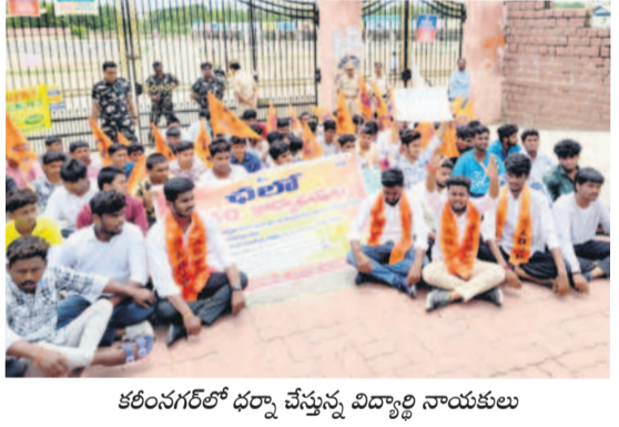
కరీంనగర్ లో భర్తా చేస్తున్న విద్యార్థి నాయకులు