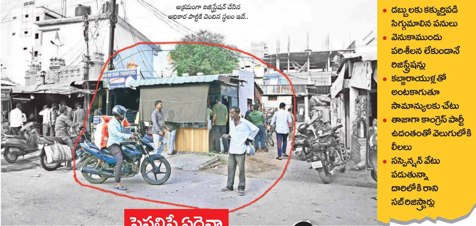
అక్రమంగా లిజిస్ట్రేషన్ చేసిన అధికార పార్టీకి చెందిన స్థలం ఇదే..