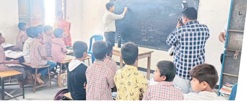
బాలుర ఉన్నత పాఠశాలలో విద్యార్థులకు పాతం చెబుతున్న కలెక్టర్ ఆశీష్ సంగ్వాన్